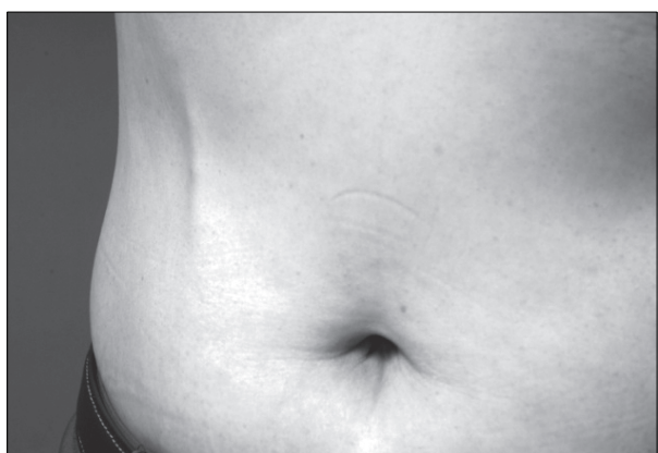
Fig. 3. Case 1. Mondor's disease on right abdomen.

(T2N0M0)였고, 조직검사 결과는 Invasive ductal carcinoma였다. 추후 보조적 항암요법으로 Tamoxifen을 이용한 Hormone therapy를 받기로 계획하였다. 환자는 수술 후 8일째 특별한 문제 없이 퇴원하였다. 외래 관찰 중에도 합병증이나 후유증은 없었으