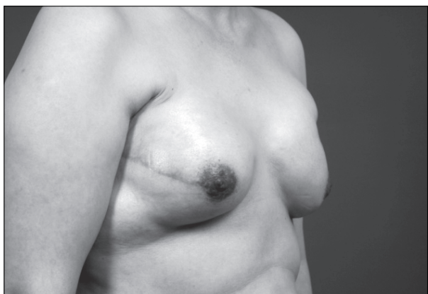
Fig. 2. Case 1. Right oblique view 10 weeks after the breast reconstruction surgery.