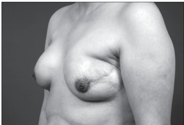
Fig. 1. Case 1. Left oblique view 10 weeks after the breast reconstruction surgery.