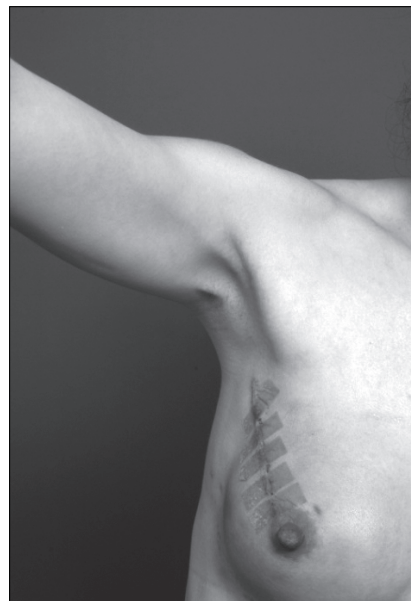
Fig. 4. Case 2. Mondor's disease on right axillary area.

(T2N0M0)였고, 조직검사 결과는 Invasive ductal carcinoma였다. 추후 보조적 항암요법으로 Tamoxifen을 이용한 Hormone therapy를 받기로 계획하였다. 환자는 수술 후 8일째 특별한 문제 없이 퇴원하였다. 외래 관찰 중에도 합병증이나 후유증은 없었으