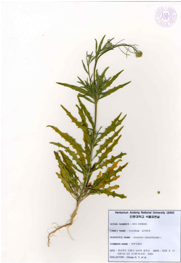
Fig. 2. A specimen of Ssuk-bu-ji-kkaeng-i ( Erysimum cheiranthoides L.)

관속식물 분포를 파악하기 위하여 수행되었다. 2006년 4월부터 2009년 8월까지 총 13회에 걸쳐 채집된 관속식물은 총 92과 273속 365종 2아종 47변종 10품종의 총 424종류로 정리되었으며, 이들을 유용성에 따라 구분하면 식용 239종류, 약용 291종류, 공업용 109종류, 관상용 135종류, 용도가 밝혀지지 않은 식물 24종이었다. 특기할 만한 식물로는 한국특산식물이 9종류, 환경부지정 법적 보호식물 II급이 2종류, 식물구계학적 특정식물이 III등급 7종류, IV등급 1종류, V등급 2종류, 희귀식물 중 멸종위기종이 1분류군, 위기종이 3분류군, 취약종이 2분류군, 귀화식물이 23종류로 나타났다.