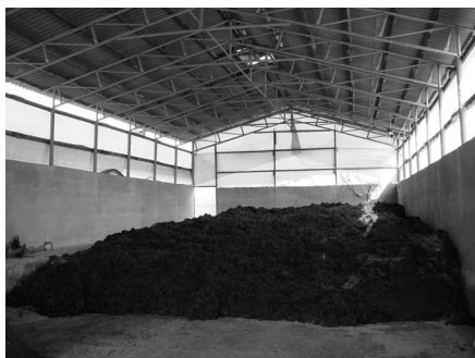
(a) Raw cattle feedlot manure

성형우분(약 10% 함수율)의 압축강도를 분석하기 위해 성형우분을 반지름 2.5 cm, 높이 4.5 cm로 가공하였다. 성형우분의 압축강도는 만능시험기(SFM-20, United Calibration