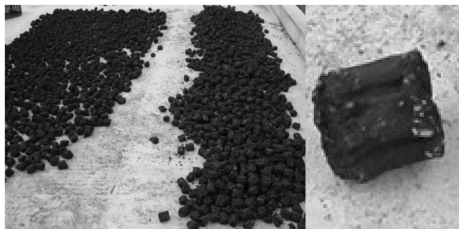
(b) Extruded cattle feedlot manure