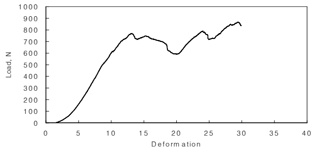
Fig. 4 Load-deformation curve for the solid fuel extruded with cattle feedlot manure.