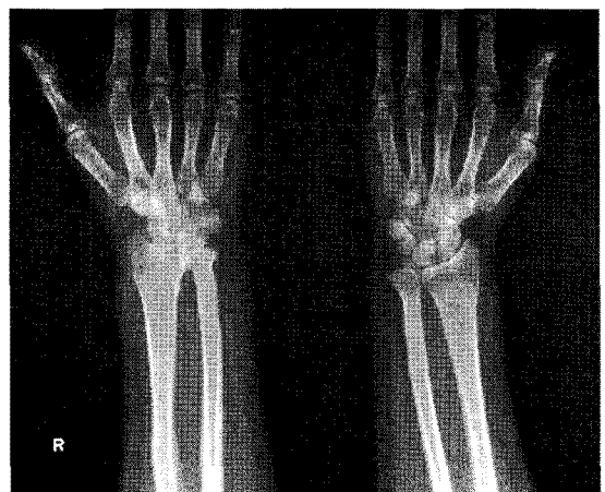
Fig. 1. X-ray of case 3