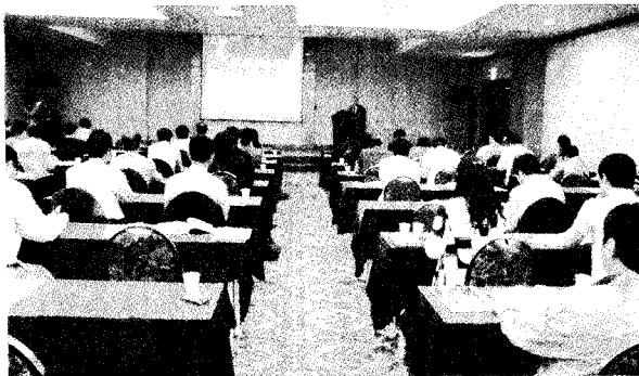
▶ 모던하이테크에서 지난 5월 10일과 11일, 서울교육문화회관에서 ‘광학인의 날’이라는 주제로 LED핵심조명기술 컨퍼런스와 CODE V 및 LightTools 유저 컨퍼런스를 개최했다.

우태주 한국광학기기협회 부회장은 “협회에서는 일찍이 광학산업의 공동발전과 관련 산업에 종사하는 광학인들이 스스로 자긍심을 가질 수 있는 방안을 고민하고 ‘광학인의 날’ 제정 및 포상식을 추진하고 있던 중에 금년에는 모던하이테크와 함께 관련 행사를 마련하게 됐다”며 “비록 작은 행사지만 모던하이테크와 협회의 노력이 보태져 국내 광학산업 발전의 모태가 될 것이라 믿으며 협회에서는 회원사들 지원업무와 광학발전을 위한 다양한 사업 추진에 최선을 다하겠다”고 말했다.