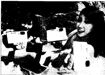
▶ 모델들이 강렬한 원색이 돋보이는 방수카메라 WP10을 선보이고 있다

삼성전자(대표·최지성)가 여름 휴가철을 맞이해 안심하고 사용할 수 있는 방수카메라 WP10을 출시한다. 방수기능은 물론 1,200만 화소 광학 5배줌, 2.7" 인텔리전트 LCD를 장착해 더욱 주목받고 있다.