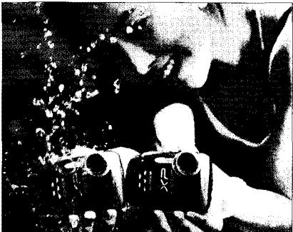
▶ 모델이 아웃도어 방수 카메라 파인픽스 XP10을 선보이고 있다.