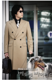
<그림 2> 베토벤 바이러스 TV 드라마 2008