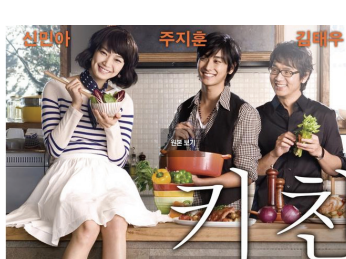
<그림 6> 키친 영화 2009