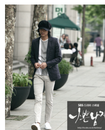
<그림 7> 나쁜남자 TV 드라마 2010