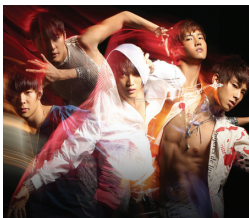
<그림 8> 동방신기 뮤직비디오 2008

유명모델에게 선택되고 나서 과감히 떠나버리는 ‘나쁜 남자’가 테마인 맥주광고에서 이민호의 이미지는 관능적인 남성성을 강조하였다. <그림 10>에서 보면 골드 색상의 글리터리한 소재로 된 슬림한 짧은 재킷, 블랙의 스키니 진을 바디컨서스로 입어 암시적으로 신체를 드러내었고 네트조직의 티셔츠를 이너웨어로 착용하여 신체를 부분적으로 노출하기도 하였다. 액세서리는 주로 핑크풍의 과감한 스타일로 징이 박힌 래더 스트랩과 밴글, 반지, 가죽장갑, 체인이 달린 허리벨트, 농구화를 코디하고 있다. 메이크업은 깨끗한 피부톤에 스모키 화장으로 강한 눈