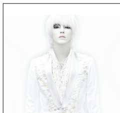
<그림 13> 이준기 뮤직비디오 2009