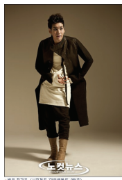
<그림 5> 정겨운 패션사진 2010