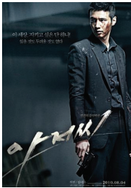
<그림 1> 아저씨 영화 2010