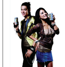
<그림 10> 이민호 맥주광고 2009