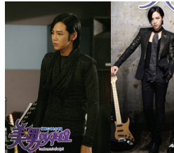
<그림 9> 미남이시네요 TV드라마 2009