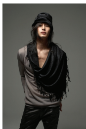
<그림 4> 이필립 패션사진 2008

2009년 상영된 <키친>에서 자유로운 영혼을 가진 ‘두레’역의 주지훈은 절친한 형의 아내를 사랑하게 되는 캐릭터이다. 사랑에는 적극적이고 거침없이 자신을 표현하고 상대방을 유혹하는 남자로서 외모나 태도는 세련된 매너, 자상함을 가진 감성적인 매력의 남성 이미지로 표현하고 있다. <그림 6>에서 의상은 편안하고 내추럴한 캐주얼 스타일로 슬림한 티셔츠, 셔츠, 베스트, 치노 팬츠를 코디하여 건강하고 활동적인 남성 이미지를 나타내었다. 메이크업은 부드러운 인상 표현을 위해 내추럴한 화장법을 사용하였으며, 헤어스타일은 세련된 이미지의 댄디 롱 웨이브 스타일을 하고 있다. 주지훈은 수려한 외모와 부드러운 눈빛, 건강한 남성 이미지로 여