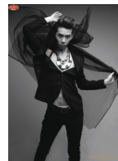
<그림 15> 조권 까페라떼 광고 2010