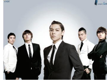
<그림 3> 빅뱅 핸드폰 광고 2008

한 성 임을 구현함으로써 ‘남성성’을 대표하는 사회적 코드가 되었다. 그러나 최근 남성성을 대표하는 유희파탈 이미지는 멋있고 감성적이며 활동적인 남성 이미지와 더불어 건강하고 완벽한 신체미를 함께 강조하는 남성적인 카리스마 2) 를 표현하고 있다.