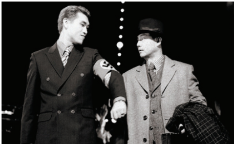
<그림 3> 카바레

『키스 미 케이트』는 휴머니즘, 사랑, 갈등, 유머가 넘치는 드라마로 비트가 강한 음악보다는 부드럽고 앙상블이 강조된 음악과 춤을 구사하고 있다(박명성, 2009). 극중극 형식을 위해 ‘말괄량이 길들이기’가 공연되는 무대는 아름답고 화려한 르네상스 초기의 의상과 무대가 펼쳐지고<그림 4>, 분장실은 1950년대 분위기의 모던하고 세련된 의상과 무대가 펼쳐진다(그림 5).