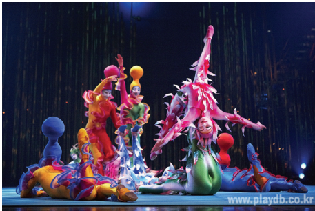
<그림 22> 태양의 서커스-바레카이

펼쳐지는 아티스트들의 액트 등 다양한 곡예적 요소가 보여진다. 특히 130여벌의 화려한 의상들과 오스카상 수상자인 에이코 이시오카가 디자인한 그리스 신화에 영감을 얻은 의상들이 신비한 공연 분위기를 연출에 큰 몫을 하고 있다(그림 22).