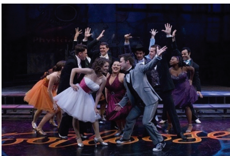
<그림 16> 풋루스

댄스 기반 공연으로는 시카고의 젊은이들이 펼치는 댄스 뮤지컬 『풋루스』 <그림 16>, 24명의 댄서들이 꿈의 무대에 도전하는 댄스 뮤지컬 『코러스라인』 <그림 17>, 프랑켄슈타인을 모티브로 반사회적 비판을 담고 있는 댄스 뮤지컬