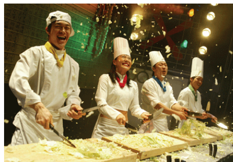
<그림 20> 난타

『퀴담』, 『알레그리아』의 흥행으로 친숙한 태양의서커스는 이카루스 신화에서 모티브를 얻은 『바레카이』로 신비한 여행의 세계를 보여준다. 『바레카이』는 인상 깊은 드라마와 환상적인 아크로바틱의 결합으로 독특한 음악과 안무, 인간 저글링, 스케이트를 타듯 미끄러운 표면 위에서