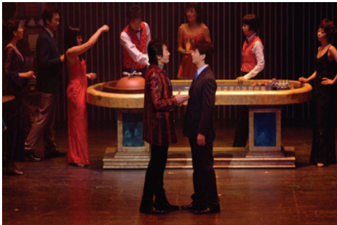
<그림 9> 갬블러

『갬블러』는 카지노를 배경으로 갬블러, 쇼걸, 백작부인의 인생들 속에서 사랑과 배신, 성공과 좌절, 욕망과 파멸의 인생 역정을 모두 체험할 수 있다. 『갬블러』의 의상은 심플한 인상을 주지만 오히려 그것이 각 인물들의 캐릭터를 정확하게 결정짓는 역할을 하며 색상의 적절한 활용으로 주인공들의 성격을 확연히 대변한다. 성당과 카지노를 넘나드는 보스의 옷차림은 모두 회색, 검은색, 흰색의 무채색으로 냉정하고 감정적 변화를 드러내지 않는, 선과 악을 넘나드는 보스의 캐릭터를 강렬하게 묘사한다(그림 9). 갬블