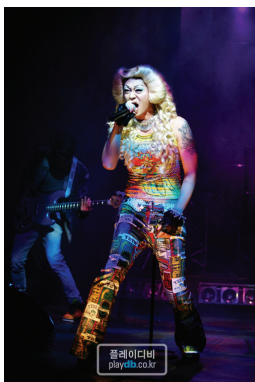
<그림 12> 헤드워

『아이다』는 누비아의 공주 아이다와 이집트 파라오의 딸인 암네리스 공주, 그리고 두 여인에게 동시에 사랑받는 장군 라다메스의 러브스토리를 소재로 한 작품이다. 메트로폴리탄 이집트관의 현대적인 모습에서 시작된 고급스러운 무대와 태양신 호러스의 눈에 불이 활활 타 오르면서 아프리카를 그대로 옮겨놓은 듯한 모습, 강렬한 태양 아래 붉은빛의 누비아, 나일강의 푸른 물 위에 돛을 휘날리며 떠 있는 이집트의 노예선 등 환상적인 색의 향연을 추구하는 스텝 막히도록 아름다운 조명, 의상, 무대의 조화는 이 작품을 브로드웨이 대표작으로 만드는데 큰 기여를 했다.