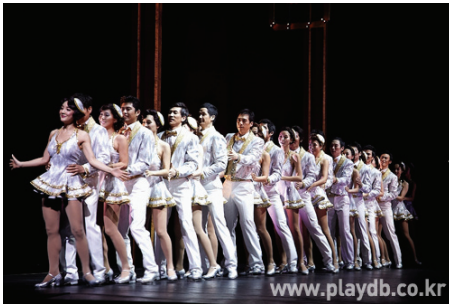
<그림 15> 브로드웨이 42번가

『브로드웨이 42번가』는 화려하고 숨막힐 정도로 빠른 템포의 진행과 40여명의 출연진이 동시에 벌이는 압권의 탭댄스 그리고 평면무대를 입체적으로 돋보이게 한 무대장치, 배우들이 가짜동전 위에서 춤추는 코인댄스 등 그랜드 스펙타클 스케일의 작품이다. 다이내믹하고 테크니컬한 탭의 앙상블, 현란하고 화려한 의상, 번쩍이며 흔들리는 스팅글 의상, 빠른 무대전환이 특징이다(그림 15).