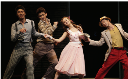
<그림 5> 키스미케이트, 1950년대 의상

이처럼 연기 기반의 공연 의상은 실생활에 착용되는 의상들의 재현, 주인공의 캐릭터를 암시