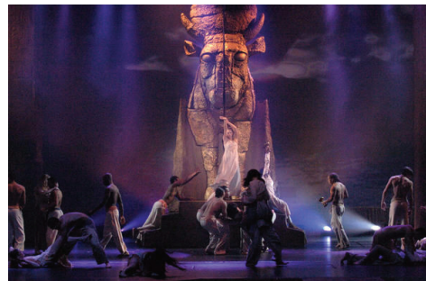
<그림 6> 미스 사이공

첫째, 오페레타는 오페라에서 기원했으므로 노래 역시 오페라풍의 노래가 주를 이룬다. 대표적인 오페레타는 『오페라의 유령』, 『레미제라블』, 『미스 사이공』 <그림 6> 같은 작품이고, 대표적인 오페라 극은 『베스와 포기』가 있다.