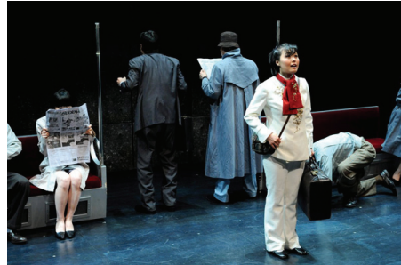
<그림 1> 지하철 3호선

『지하철 1호선』은 연변처녀 ‘선녀’의 눈을 통해 서울 사람들의 모습을 그리고 있다. 실직가장, 가출소녀, 잡상인, 사이버 전도사 등 우리 주변에서 만날 수 있는 다양한 사람들의 모습과 분위기를 검정, 회색의 어두운 톤으로 표현하여 어두운 시대상을 암시하고, 주인공 여성은 대비되는 흰색 의상에 연변처녀임을 강조하는 빨간 스카프로 강조하였다(그림 1). 5인조 록밴드 ‘무임승차’의 우스꽝스러운 가발과 모피의상은 강렬한 라이브 연주와 함께 한국사회의 모습을 풍자와 해학으로 그려내었다.