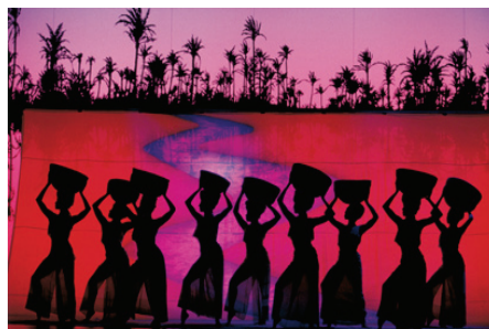
<그림 13> 아이다

『아이다』는 누비아의 공주 아이다와 이집트 파라오의 딸인 암네리스 공주, 그리고 두 여인에게 동시에 사랑받는 장군 라다메스의 러브스토리를 소재로 한 작품이다. 메트로폴리탄 이집트관의 현대적인 모습에서 시작된 고급스러운 무대와 태양신 호러스의 눈에 불이 활활 타 오르면서 아프리카를 그대로 옮겨놓은 듯한 모습, 강렬한 태양 아래 붉은빛의 누비아, 나일강의 푸른 물 위에 돛을 휘날리며 떠 있는 이집트의 노예선 등 환상적인 색의 향연을 추구하는 스텝 막히도록 아름다운 조명, 의상, 무대의 조화는 이 작품을 브로드웨이 대표작으로 만드는데 큰 기여를 했다.