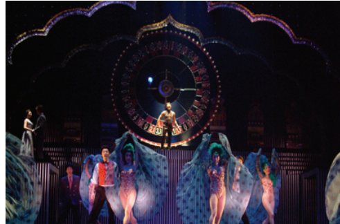
<그림 10> 갬블러

러 역시 단정하면서도 모범적인 성격과 검소함을 의상이 은유적으로 드러내며 쇼걸의 붉은색과 초록색은 그녀의 정열과 양면성을 상징한다. 백작부인의 보라색은 신비스러운 비밀을 감추고 있는 그녀의 성격과 신분상의 고귀함을 표현하는 메타포이다(그림 10).