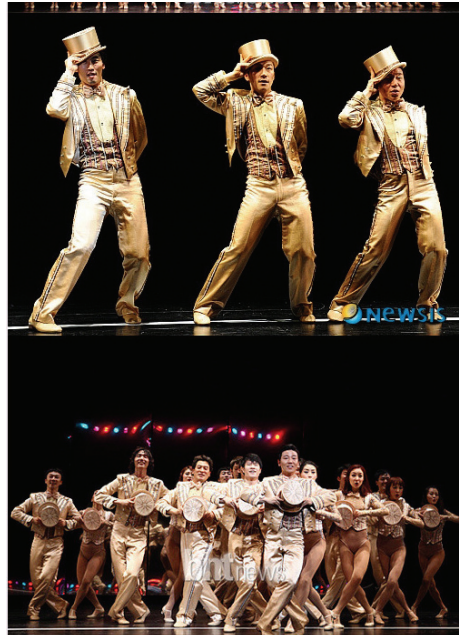
<그림 17> 코러스라인

『록키호러쇼』 <그림 18>, 한국 전통무술을 바탕으로 한 화려하고 고난도의 댄스 무술을 보여준 『점프』등이 있다.