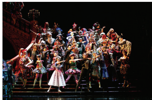
<그림 7> 오페라의 유령

『오페라의 유령』은 파리 오페라 하우스를 배경으로 크리스틴과 오페라의 후원자인 귀족 청년 라울, 흥측스러운 외모와는 달리 순수한 영