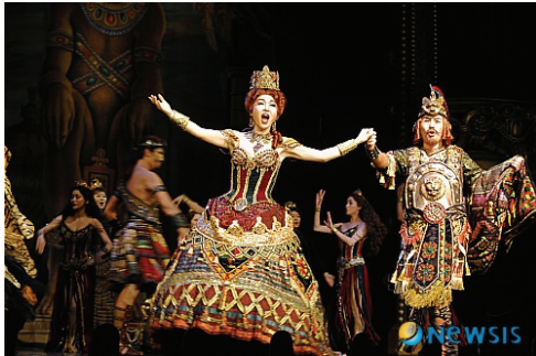
<그림 8> 오페라의 유령

혼을 지닌 죽음의 사신으로 분하여 등장한 팬텀, 팬텀의 하얀 가면이 등장한다. 140여명에 이르는 배우와 시대를 고증한 230여벌의 화려한 의상<그림 7, 8>, 1톤에 이르는 유리구슬로 치장한 상들리에, 파리의 오페라하우스를 그대로 옮겨놓은 듯한 무대와 음침한 지하세계 등 수준 높은 무대예술의 경험을 할 수 있다.