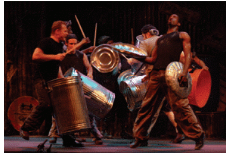
<그림 19> 스템프

이밖에도 『태양 서커스단(Cirque du Soleil)』의 『퀴담(Quidam)』, 『알레그리아』 <그림 21>, 『바레카이』같은 서커스적인 스펙타클 쇼도 율동과 리듬 기반의 공연이라고 할 수 있다.