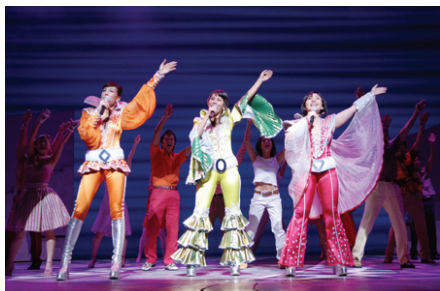
<그림 11> 맘마미아

들, 여성도 남성도 아닌 독특한 캐릭터를 잘 부각시키고 있다(그림 12).