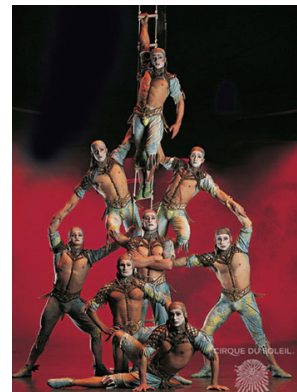
<그림 21> 태양의 서커스-알레그리아

『퀴담』, 『알레그리아』의 흥행으로 친숙한 태양의서커스는 이카루스 신화에서 모티브를 얻은 『바레카이』로 신비한 여행의 세계를 보여준다. 『바레카이』는 인상 깊은 드라마와 환상적인 아크로바틱의 결합으로 독특한 음악과 안무, 인간 저글링, 스케이트를 타듯 미끄러운 표면 위에서