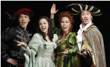
<그림 4> 키스미케이트, 르네상스 초기 의상

『키스 미 케이트』는 휴머니즘, 사랑, 갈등, 유머가 넘치는 드라마로 비트가 강한 음악보다는 부드럽고 앙상블이 강조된 음악과 춤을 구사하고 있다(박명성, 2009). 극중극 형식을 위해 ‘말괄량이 길들이기’가 공연되는 무대는 아름답고 화려한 르네상스 초기의 의상과 무대가 펼쳐지고<그림 4>, 분장실은 1950년대 분위기의 모던하고 세련된 의상과 무대가 펼쳐진다(그림 5).