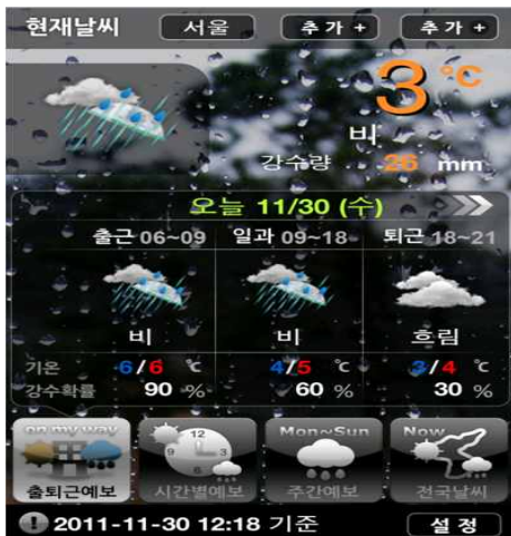
(그림 3) 'Olleh 날씨' 앱의 메인화면

이러한 기존 앱을 분석하여 기존의 유사 앱과 다른 기능을 중심으로 연구하여 알람 시스템을 탑재하여 알람 이벤트가 작동할 때 마다 음성으로 날씨 정보를 동 단위 및 시간 단위로 제공하도록 설계하였다.