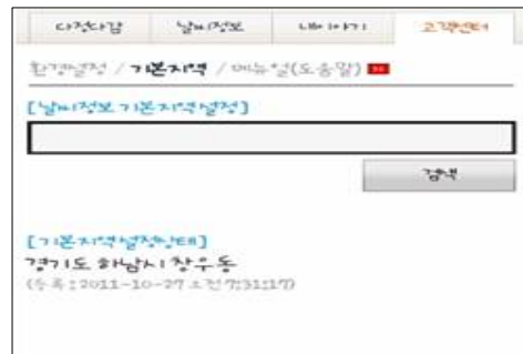
(그림 1) ‘어제 오늘’ 앱의 지역설정

이러한 요소들을 고려하여 본 논문의 날씨 정보 앱은 GPS시스템을 탑재하여 지역 설정 없이도 자신이 위치한 지역에 날씨를 동 단위 및 시간단위로 출력할 수 있도록 설계하였다.