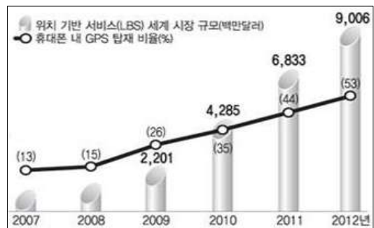
(그림 4) LBS 시장 규모

최근에 출시되고 있는 스마트폰은 차량 내비게이션 장치를 비롯해 휴대전화 그리고 디지털 카메라에 이르기까지 위치 정보를 사용하는 것이 보편화 되어 있고, (그림 4)와 같이 2007년부터 2012년까지의 LBS시장 규모를 통해 각 년도마다 발전된 GPS 탑재 비율을 확인 할 수 있다[3].