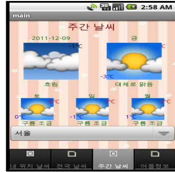
(그림 15) 주간 날씨