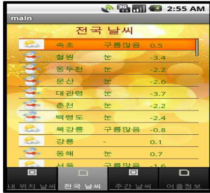
(그림 13) 전국 날씨 정보