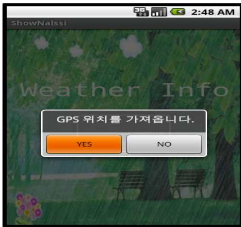
(그림 10) GPS 위치

(그림 10)은 어플리케이션의 메인화면으로 GPS위치 프로바이더를 이용하여 순방향 지오코딩을 통하여 경도와 위도 값을 가져와 위치 정보에 맞는 날씨 정보를 출력한다. 이러한 위치 정보를 이용해서 기상청의 날씨 정보를 XML 파싱기법을 이용하여 (그림 11)과 (그림 12)와 같이 동 단위와 시간 단위로 출력한다.