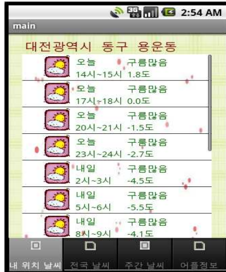
(그림 12) 현재위치 날씨 정보