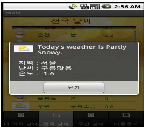
(그림 14) 음성(English) 날씨 정보

기존 유사 날씨 어플리케이션의 차별화 된 기능 중 하나로, 알람 기능을 탑재하여 알람 이벤트가 진행 될 때 마다 그에 맞는 시간대의 날씨 정보를 음성(English)으로 아래 그림과 같이 대화상자와 함께 출력한다. 이러한 알람 시스템을 이용하면 어플리케이션의 접속과 종료의 상관없이 그 날의 날씨 정보를 시간 단위로 확인하므로 사용자에게 편의성을 제공한다.