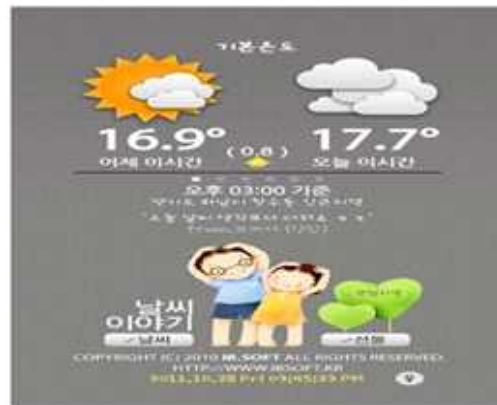
(그림 2) ‘어제 오늘’ 앱의 메인화면