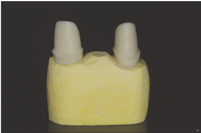
Fig. 1. Prepared resin teeth embedded in stone (labial view).