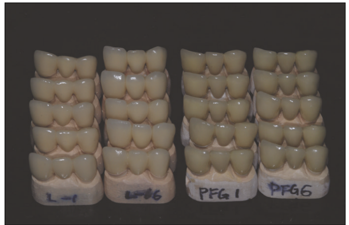
Fig. 4. LAVA and PFG bridges.

지대치 삭제 후 인상을 부가 중합형 실리콘 인상재 (Exafine, GC, Tokyo, Japan)로 putty와 light body를 이용하여 인상을 채득하였다. 20개의 인상을 채득하여 20개의 레진 모형 (Exakto-Form, Bredent, Senden, Germany)을 제작하였다 (Fig. 3). 제작된 레진 모형은 10개씩 두 군으로 분류하였다. 각각의 레진 모형을 다시 인상 채득하여 20개의 초경석고 모형을 제작하였다. 이 중 10개는 통상적인 PFG 3-unit bridge를 제작하였고 10개는 LAVA (3M ESPE, Seefeld, Germany) 3-unit bridge를 제작하였다 (Fig. 4). PFG bridge는 통상적인 방법으로 veneering 하였고 LAVA는 제조사의 추천대로 제작하였다. 제작된 각각의 bridge를 레진 모형에 레진 시멘트 (RelyX Unicem, 3M ESPE, Germany)를 이용하여 접착하였다. 접착시에는 임상적인 상황을 재현하기 위해 finger pressure를 이용해 접착하였다. 각각의 시편의 변연 적합도를 실체현미경 (Stereoscopic microscope, Nikon DS-Fi 1, Nikon, Japan)을 이용하여 75배의 배율로 측정하였다. 각 지대치 당 순면, 설면, 근심, 원심의 4점에서의 거리를 측정하였다. 측정 시에 connector 하방의