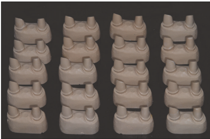
Fig. 3. Resin models.