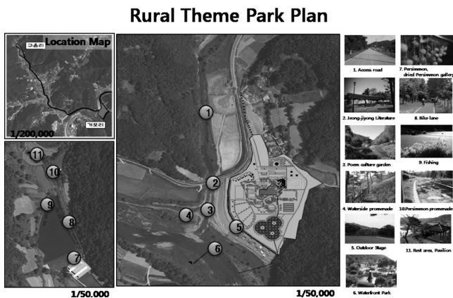
Fig. 3 A scheme drawing of master plan

농촌테마공원은 농촌에 조성되는 특성으로 일반테마공원과는 다르게 접근체계를 중요하게 고려해야 한다. 이러한 접근체계는 농촌테마공원의 부지 선정시에 연결된 도로와 공원조성예정지의 대중교통현황 등을 고려해야하고, 조성 후에도 접근성이 용이