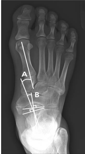
Figure 3. Weightbearing foot anteroposterior radiograph. (A) Talar-first metatarsal angle. (B) Talonavicular coverage angle.

시행하였으며 부주상골과 후경골건, 연골 결합을 각각 확인하였다. 연골 결합은 주상골과 부주상골 양측에서 모두 소파술을 시행한 다음 후경골건을 부착부에 최대한 가까운 위치에서 건의 종축을 따라 절개하고 절개된 후경골건 사이로 Mini-Acutrek ® 나사(Acumed, Hillsboro, Oregon, USA)