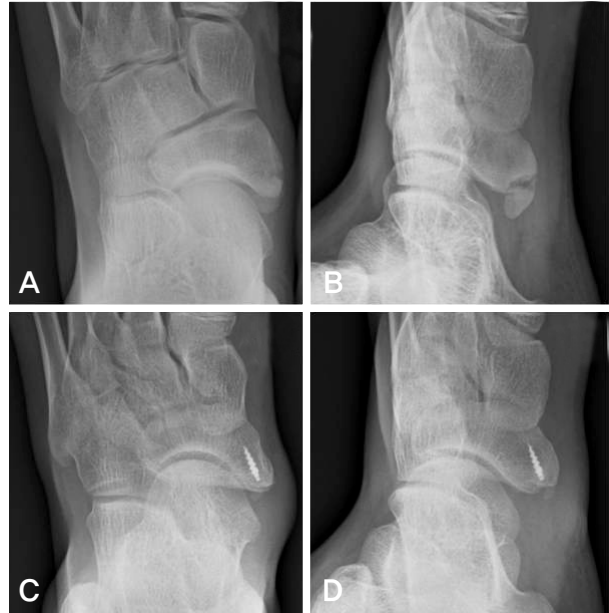
Figure 1. A 13-year-old boy with excision. (A) Weightbearing foot anteroposterior radiograph before the operation. (B) External oblique radiograph before the operation. (C, D) Suture anchor inserted sufficiently in primary navicular at 5 years after the operation.