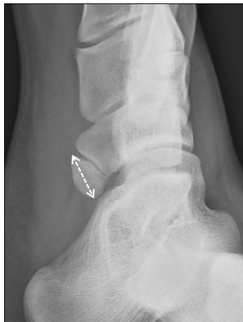
Figure 5. Measurement of size of accessory navicular on non-weightbearing foot external oblique radiograph.

를 삽입하여 부주상골을 주상골에 고정하였다. Mini C-arm 을 이용하여 나사의 위치를 확인한 후 절개한 후경골건을 봉합하였다. 골막, 피하 조직, 피부를 각각 봉합한 후 단하지 석고 부목을 적용하여 6주간 유지하였다(Fig. 2).