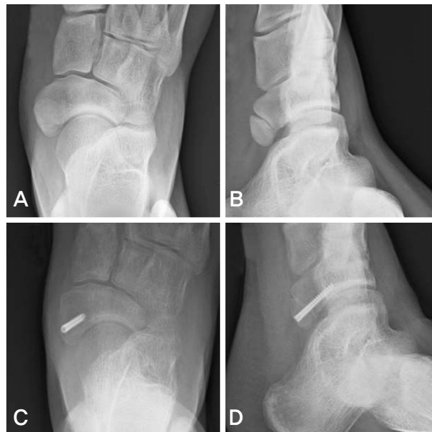
Figure 2. A 16-year-old girl with osteosynthesis. (A) Weightbearing foot anteroposterior radiograph before the operation. (B) External oblique radiograph before the operation. (C, D) Complete bone union between primary and accessory navicular was shown at 18 months after the operation.