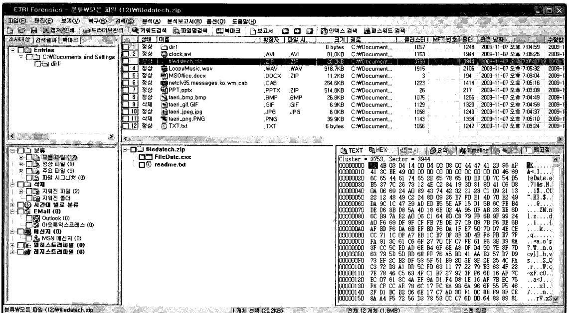
(그림 2) ETRI Forensics 실행 화면