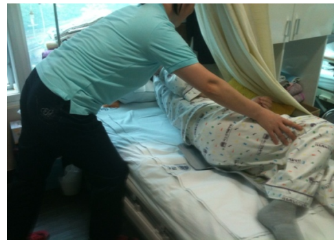
Figure 2. Change of position