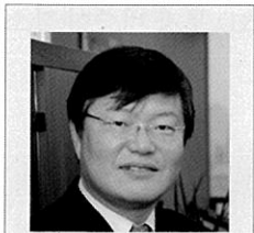
글 이장재 KISTEP 선임연구위원