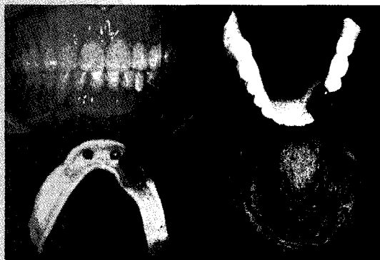
Fig. 1. 하악에 #33, 34 치아만 남은 환자에서 임플란트 2개 식립 후 국소의치 제작함