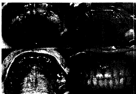
Fig. 3. 상악에 #26, 27 치아만 남은 환자에서 임플란트 4개 식립 후 Hader bar 이용하여 palateless removable partial denture 제작함.

implant 2개를 심은 후에 locator를 이용하여 부분 가철성 의치를 제작하였다. Overdenture를 통해 유지력을 증가시키는 효과를 얻을 수 있었으며 견치에 retentive arm을 생략하여 환자를 좀 더 심미적으로 만족시킬 수 있었다. 또한 소구치 rest 외의 전치부 locator에서 얻은 부수적인 지지효과 증대를 통해 하악 후방 연장 부위의 수직 교합력을 감소시켜 f/u 시에 후방 연장 부위 골 흡수 속도가 감소됨을 확인할 수 있었다.