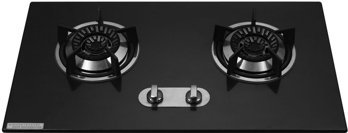
주방가구에 함께 설치되는 빌트인 연소기

최근 국민소득 증가와 주거환경의 변화로 주방의 편의성 및 미관을 위해 빌트인 연소기(주방가구 안에 일체로 설치된 연소기) 설치가 증가하고 있다. 하지만 빌트인 구조로 연소기를 설치할 경우 연소기와 호스의 접속 부분은 은폐구조로 되어있어 일상점검이 불가능함에 따라 안전관리상 문제가 발생하고 있다.