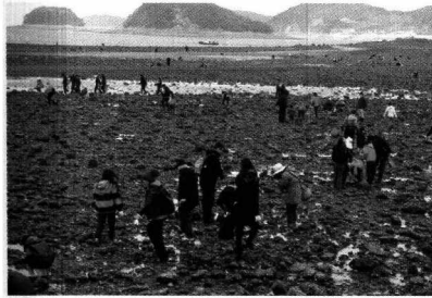
〈도비도해양체험관 갯벌로 이동〉