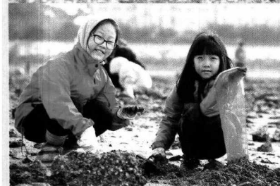
〈갯벌체험 현장 모습〉

이날 함께 온 당진화력본부 가족들에게 바지락을 캐 호미, 그리고 그물망과 장갑을 나눠준 뒤, 갯벌체험에 나섰다.