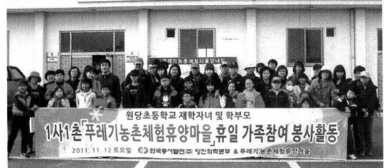
〈푸레기마을을 방문한 한국동서발전(주) 당진화력본부 가족〉