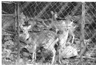
〈동물농장에서 키우는 사슴〉

찾는 명소가 되었는데, 현재는 리모델링공사가 진행 중이며 2012년부터 다시 운영한다고. 또한 이 약쑥을 이용해 뜸, 좌욕, 약쑥음식 만들기 등 다양한 체험관광을 즐길 수 있고, 이를 상품화한 제품 판매를 통해서도 매출을 올리고 있었다.