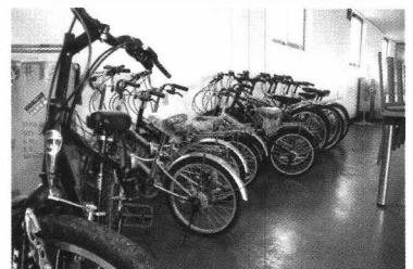
〈마을 체험용 자전거〉