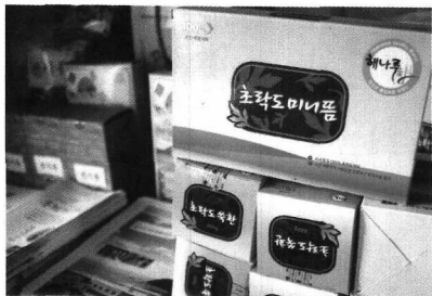
〈약쑥으로 생산한 제품들〉

이중 ‘약쑥’이 가장 유명한데, 연간 40톤을 수확해 1억 원 이상의 매출을 올린다고 한다. 특히 약쑥찜질방은 전국에서 연간 6천명 이상이