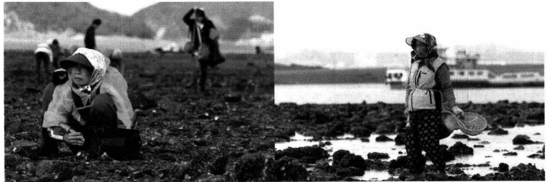
〈삶의 현장인 갯벌에서 일하시는 할머니들의 모습〉

필자는 언제부터였는지 미리 갯벌에 와서 바지락과 굴을 캐고 있는 할머니 한분께 다가가 ‘사진 좀 찍어도 될까요?’ 하고 묻자, 할머니는 입가에 살짝 웃음을 보이시며 갯벌에서 갯 썩 굴을 저에게 먹어보라고 권하셨다. 사실은 옆에서 계속 입맛을 다시며 침을 삼켰던게다. 제가 보낸 무언의 텔레파시에 할머니는 그렇게 되받아주셨다. 그나저나 그