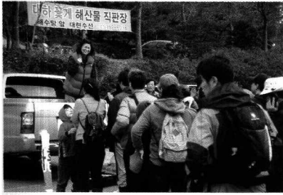
〈갯벌체험에 앞서 안전교육〉