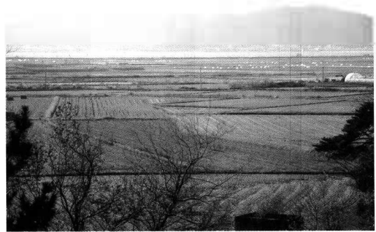
〈푸레기마을의 비옥한 농토〉

때문에 그 소득창출이 일정하지 않는 것이 현실” 이라면서도 “농가소득이 늘어나는 것도 좋지만 더욱 중요한 것은 사람들이 좋아서, 사람들이 마을을 찾아와 함께 고향의 정을 나누고 동참하는 것이라 믿는다.”고 소신을 밝혔다.(그러면서 마지막 한 마디 보탠다... 나 말 너무 잘 하죠~ 호호호)