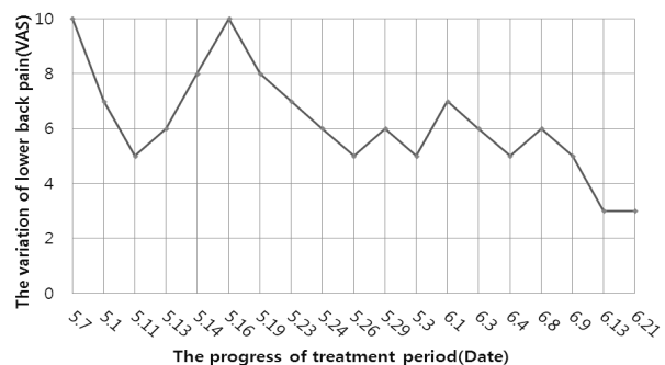
Fig. 2. The variation of VAS about low back pain

脊湯, 灸, 물리치료를 시행하였다. 쪼그려 앉았다 일어 서기 및 평지보행, 계단상하행이 가능해지고 지속가능한 시간도 꾸준히 늘어났으며 그럼에도 요통은 악화 없이 절반 이하로 완화되었다. 퇴원 직전에는 계단을 수차례 오르내리기도 통증의 악화나 무력감의 인식이 없었으며 원내 산책 등을 자유로이 시도할 정도로 근력 및 보행상태가 개선되었다. 심리적으로도 안