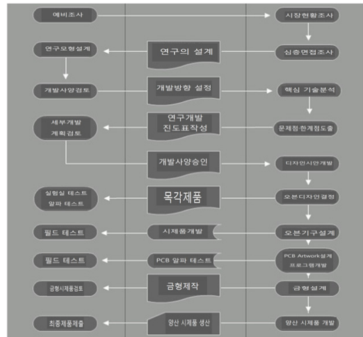
[Fig. 1] Oven developing methods of propulsion and propulsion system

본 연구에서는 체계적이고 과학적인 연구를 수행하여 가정 및 식품·외식업체에서 실제 사용할 수 있는 소형 복합오븐을 개발하고자 하였다. 복합오븐의 디자인 렌더링, 모형화와 빌트인 시스템의 컬러링을 [Fig 2]~[Fig 3]에 제시하였다.