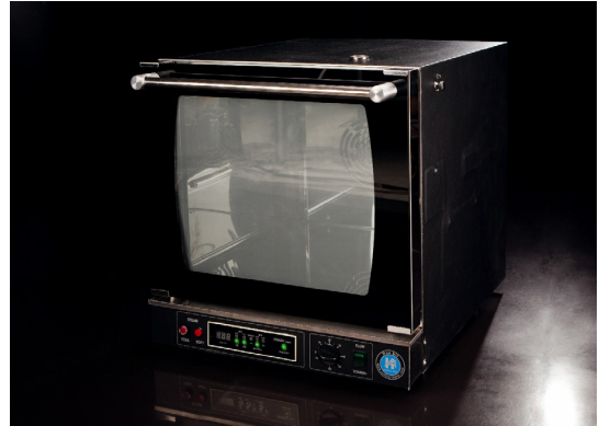
[Fig. 6] Final development of products