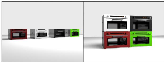
[Fig. 4] Coloring of multi-function oven

소형 복합오븐 외장의 디자인 색채는 (A)와 (B) 집단은 고급스럽고 안정감 있는 스테인리스 재질과 메탈블랙 색상을, (C) 집단은 블랙 & 화이트, 블랙컬러를 선호하였다. 젊은 층은 산뜻한 클래식 레드나 밝은 화이트, 편안한 그린컬러 등 화사하면서 밝고 우아한 색상을 선호하는 것으로 조사되었다. 이와 같은 요구도를 반영하여 주방가구에 어울리는 컬러링을 [Fig 4]~[Fig 5]에 제시하였다.