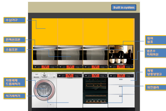
[Fig. 5] Coloring of Built in system