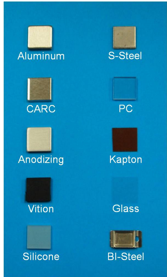
Fig. 1. Biological Agent surrogate test coupons : 1.8 cm squares(S-Steel ; Stainless steel, PC ; Poly-Carbonate)

본 실험에서는 40% 에탄올에 현탁된 G. stearothermophilus (ATCC 12980) 아포( 1 \times 10^8 Colony Forming Unit[CFU])를 MESA Labs(Colorado, USA)에서 구매하여 사용하였다. 쿠폰 재질로는 주변에서 흔히 볼 수 있는 재질로서 유리, 알루미늄 3종(일반, CARC, 애노다이징), 실리콘, 바이톤, 스테인레스 스틸, 폴리 카보네이트, 캡톤 쿠폰을 자체 제작하여 사용하였다 (Fig. 1).