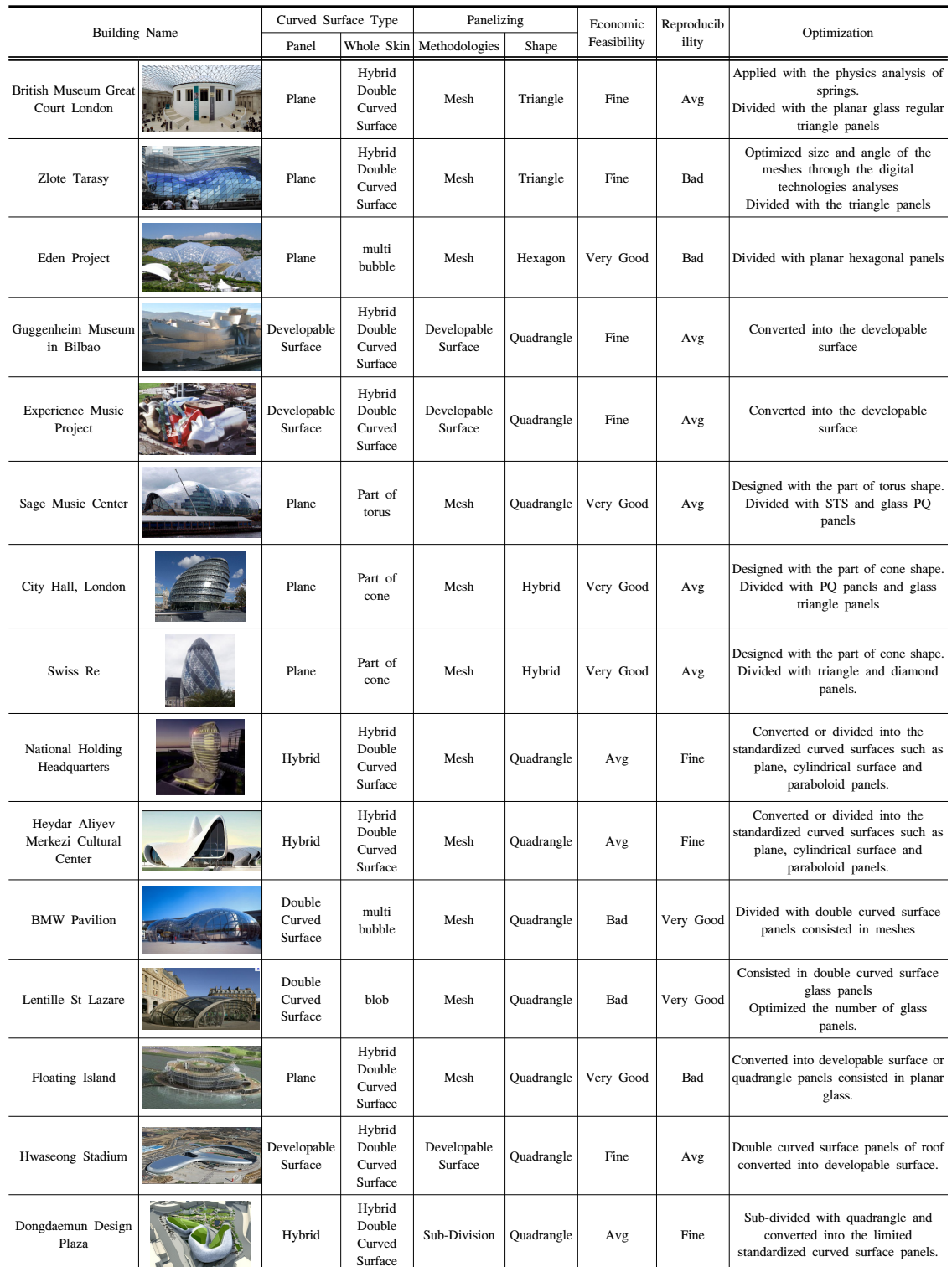
[Table 3] The classification of case studies by the curve, paneling and optimization