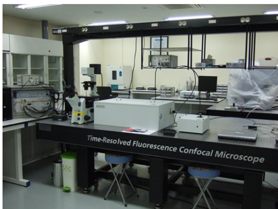
그림 2. 한국기초과학지원연구원 강릉센터에 설치된 시분해 형광 공초점 현미경 사진.