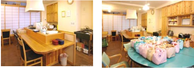
[Figure 7] Interior of Aneyakouji Senior Salon