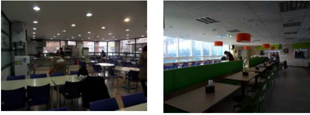
[Figure 11] Furniture Layout of Senior Dining Spaces of Elderly Welfare Centers in Seoul

고령자에 대한 식사지원서비스가 필요하며, 이러한 공간은 기존의 복지관, 경로당, 종교시설 등 커뮤니티 내 기존공간의 리노베이션을 통해 활용하는 방법을 찾는 것이 바람직하다.