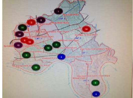
[Figure 2] Tower Hamlets Area Lunch Club Allocation ( http://www.towerhamlets.gov.uk )

현재 타워햄릿 지역에는 16개소의 런치클럽이 운영되고 있으며 많은 수의 런치클럽이 이용자의 문화적인 특성을 고려하여 서비스가 제공되고 있다. 인구비율로 볼 때 전체 거주인구 15,000명당 1개소의 런치클럽이 운영되고 있다.