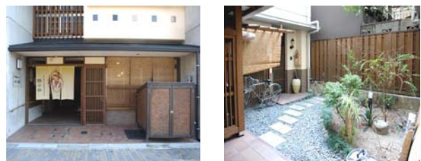
[Figure 6] Entrance and Garden of Multi-Purpose Senior Welfare Center Aneyakouji

교토시 나카교구(京都市 中京区)에 위치한 소규모다가능 시설 아네야코지(姉小路, Aneyakouji)는 노인주간보호시설과 노인그룹홈으로 이루어진 시설인데, 1층에는 도시락 배달과 동네 노인들의 사랑방 역할을 하는 살롱 공간을 두고 있다.