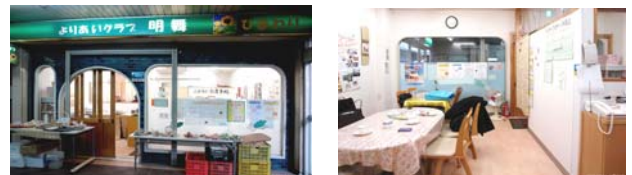
[Figure 5] Entrance and Interior of Senior Meal Service Space in UR Meimai Housing Complex

NPO단체가 상가 내에 작은 매장을 설치하여 식사준비가 어려운 고령자들에게 저렴한 비용을 받고 식사배달을 하고 있다. 고령자들이 언제나 들러서 저렴한 비용으로 식사를 하거나 차를 마실 수 있는 동네 사랑방의 역할도 하고 있다. 또한 고령자들을 위한 좋은 식재료들도 판매하여 멀리 떨어진 마트에 가기 어려운 고령자들을 위하여 건강에 좋은 먹거리도 제공하고 있다.