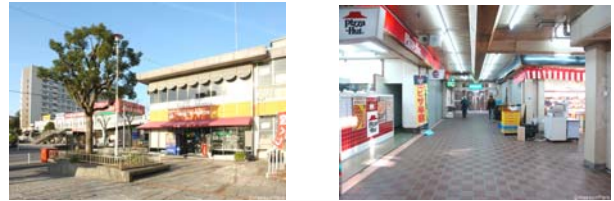
[Figure 4] Small Food Store for Senior Meal Delivery and In-room Dining in UR Meimai Housing Complex

일본에도 다양한 형태의 고령자 식사서비스센터를 운영하고 있다. 일본 효고현(兵庫県) 고베시 타루미구(神戸市垂水区) 및 아카시시(明石市)에 위치한 메이마이 UR임대주택단지(明舞團地, UR Meimai Housing Complex)는 건축된 지 30년 이상 된 주거단지다. 이곳에서는 도시재생 프로그램의 일환으로 주택단지 내에 다양한 NPO(사회적 기업)가 참여하여 고령자들을 위한 프로그램을 제공하고 있다.