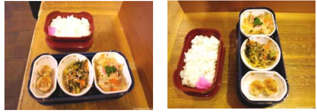
[Figure 10] Home-style Meal Service and Meal Delivery Container