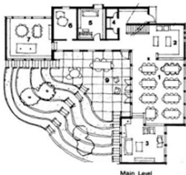
[Figure 3] Cohousing Common Space Design as a role of Community Kitchen (Cohousing-Designing the Urban Village : http://cohousing.webs.com/ )

대부분의 커뮤니티센터는 커뮤니티키친을 중심으로 식사 배달과 회합식사를 병행해서 운영하는 형태로 운영되고 있다. 식사배달서비스의 프로그램을 통해서 메뉴 구성이나 위생상태 등이 체계적으로 관리되고 있으며, 음식서비스(food service)가 필요한 사람들이 손쉽게 서비스에 접근할 수 있는 정보 제공이 이루어지고 있다. 식사공간도 단시간에 많은 식사를 제공하는 것 보다는 적절한 인원의 할당을 통하여, 고령자들이 보다 쾌적한 상태에서 식사할 수 있도록 배려하고 있다.