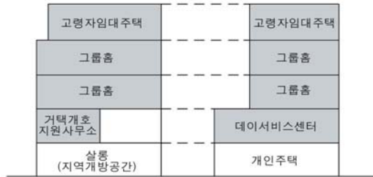
[Figure 8] Section of Aneyakouji

아네야코지의 시니어살롱은 주거단지 안에 위치한 메이마 이단지의 식당과는 달리 소규모 노인시설에 병설되어 있으며, 우리나라의 노인복지관의 식당보다 소규모로 지역 노인들이 편안하게 들러서 식사하고 쉬었다 갈 수 있는 공간이다.