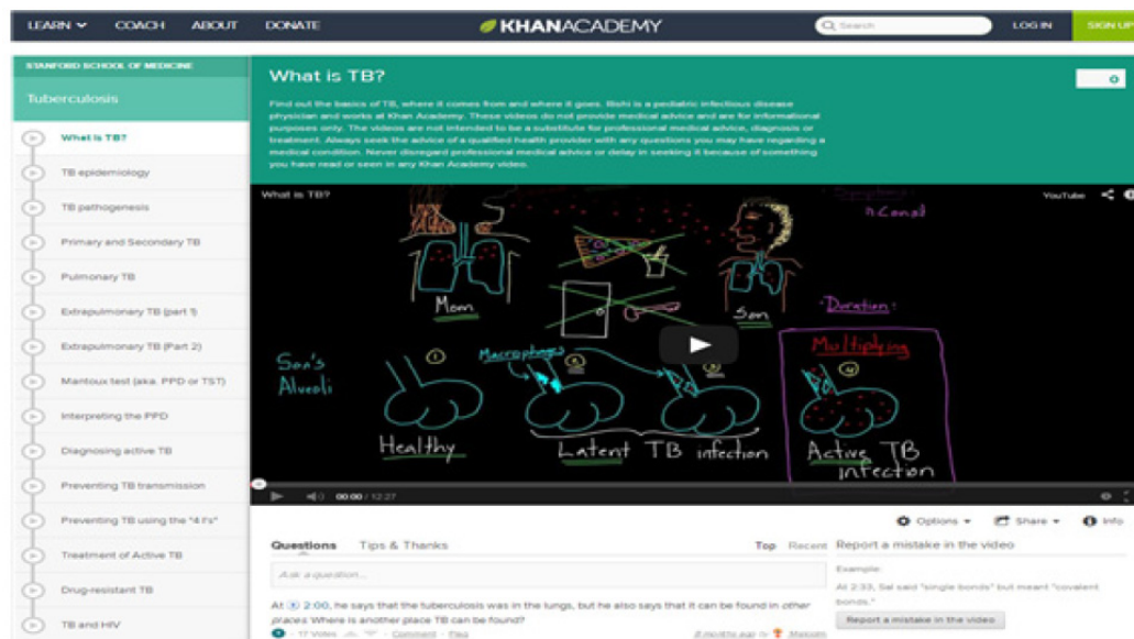
Figure 2. A lecture page of the Stanford School of Medicine in Khan Academy.

스탠포드대학의 Prober & Heath (2012)는 의과대학에서 이러한 플립드 러닝을 보다 적극적으로 활용할 것을 제안하고 있는데, 플립드 러닝의 형태로 수업을 진행할 경우 학생은 수업 전에 과제로서 교수자의 강의를 디지털 자료를 활용하여 학습하고, 수업시간에는 이를 바탕으로 지식의 적용이나 활용에 보다 초점을 맞출 수 있기 때문이다. 의과대학에서는 흔히 사례기반학습이나 문제기반학습, 그리고 팀기반학습으로 수업이 진행되는 경우가 많은데, 플립드 러닝의 형태로 수업을 진행할 경우 선행학습에 이어 진행되는 교실수