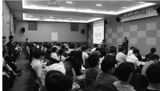
그림 4. 준비워크숍 개최

그리고 우리나라 농업개발의 성공모델을 보다 생생하게 소개하고자 다양한 기술견학 프로그램을 준비하고 있다. 국제사회의 지원과 협조, 정부의 노력, 국민의 협동으로 성공을 이룬 영산강 농업종합개발사업과 세계최장의 방조제와 앞으로 동북아 경제 중심지로 비상할 새만금 농업종합개발사업이 그 대상이다. 현재 참가자들을 위한 기술견학안내서 등이 제작되었으며, 한국농어촌공사 새만금 및 영산강 사업단에서는 참가자에게 보다 상세하고 의미 있는 현장설명을 제공하기 위하여 다양한 콘텐츠를 준비하고 있다.