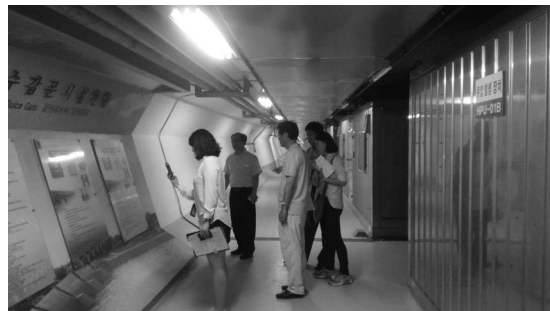
그림 5. 기술견학프로그램 준비