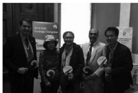
그림 3. 해외 홍보활동