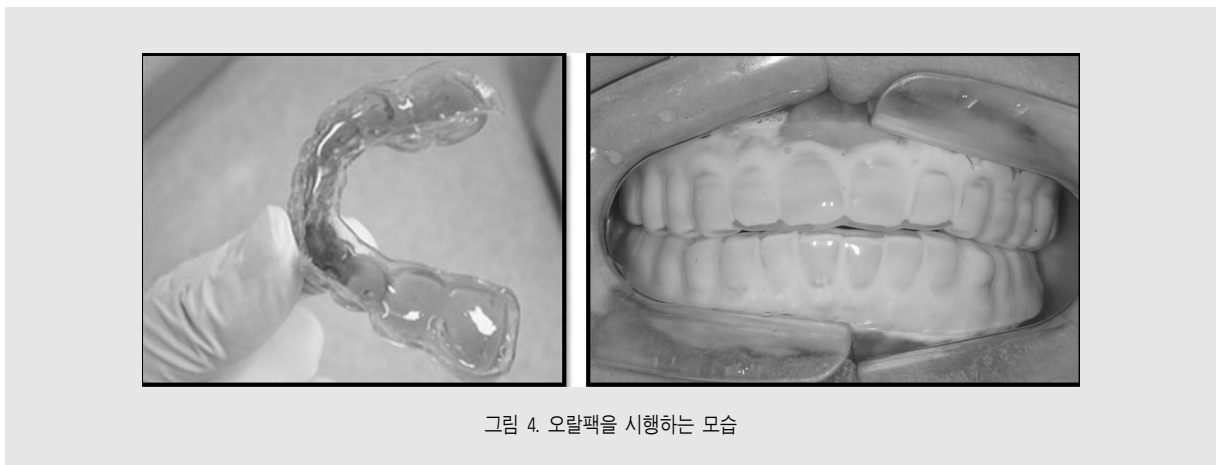
그림 4. 오랄팩을 시행하는 모습

치의학 분야에서는 과거부터 치아미백 치료를 위하여 환자의 구강 내 인상을 채득하고, 그 틀을 이용해 만든 모형에 맞춰 개인용 맞춤형 트레이(individual customized tray)를 제작해서 사용해 왔다. 그런데 이러한 개인용 맞춤형 트레이를 굳이 미백 치료에만 사용하지 않고, 다양한 목적으로 활용하려는 시도가 있었는데, 그것이 바로 오랄팩이다. 일본에서는 개인용 맞춤형 트레이에 클로르헥시딘 젤을 넣고 구강 내에 끼워 사용함으로써 환자의 Mutans streptococci 수준을 조절하려는 “3DS system(Dental Drug Delivery system)”이 활용되어 왔으며 8) , 미국에서는 이러한 치료법을 치주질환자의 관리에 활용한 “Perioprotect”라는 방법으로 활용해 왔다. 그러므로 치과에서는 전문가용 불소젤이나 클로르헥시딘 젤 등의 고농도 전문가용 제품을 이용한 전문가 오랄팩(professional oral pack) 치료법을 시행하고, 환자는 가정에서 저농도의 유효 성분이 함유된 치약을 활용한 가정용 오랄팩(home oral pack)을 시행하는 것이 가능하다(그림 4).