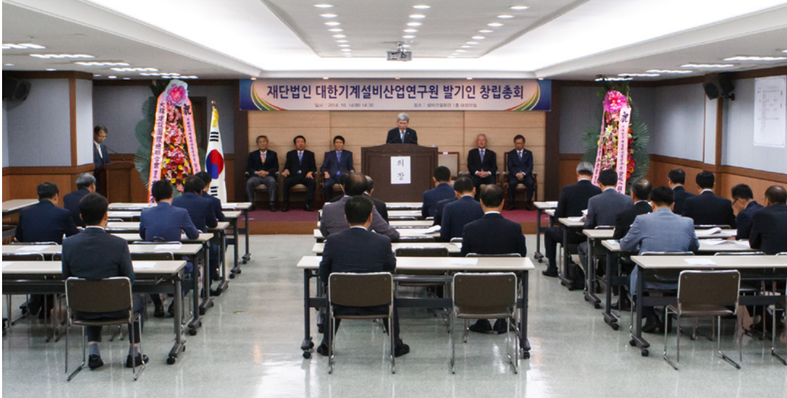
대한설비건설협회와 대한설비건설공제조합은 지난 10월 14일 설비건설회관 대회의실에서 대한기계설비산업연구원 발기인 창립총회를 개최했다