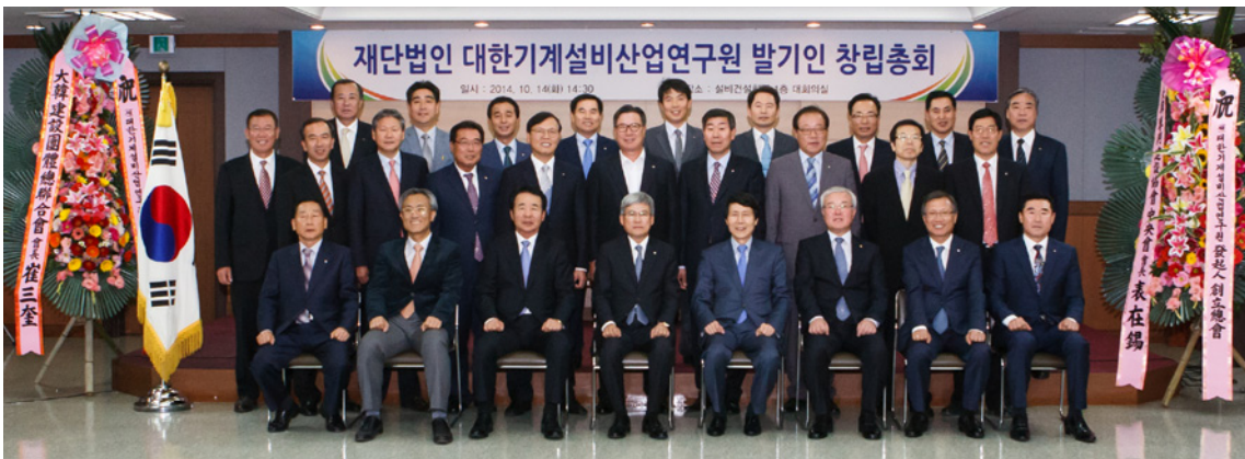
발기인 창립총회가 끝난 후 기념촬영