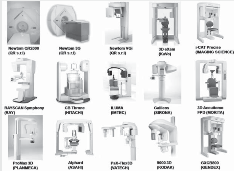
Fig. 1. 여러가지 CBCT 장비