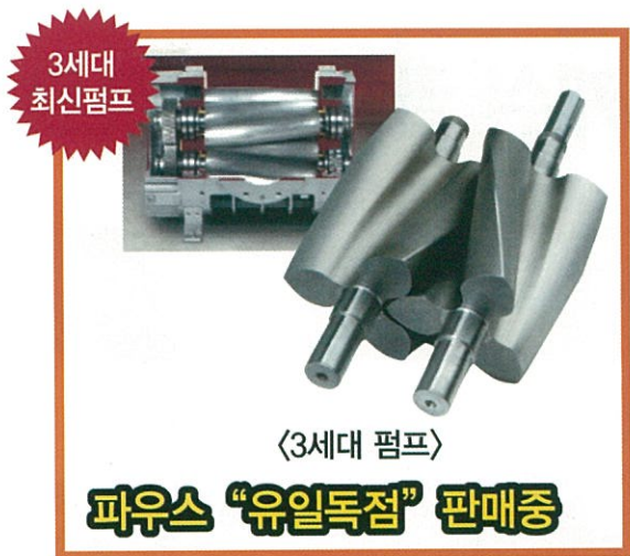
파우스에서 독점 판매권을 가지고 판매에 나선 3세대 무주입진공발생기

성장하기 시작했고, 최근에는 1세대, 2세대에 이어 3세대 최신 무주입진공펌프의 독점 판매권까지 계약함으로써 선진기술과 신제품을 결합한 최고의 착유설비인 무주입진공발생기와 함께 공식 판매하고 있습니다.”