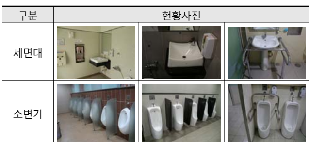
[Table 11] Picture of Urban Railway Station Toilet In Terms of Washbasin and Urinal