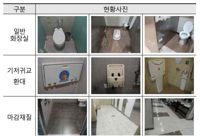
[Table 13] Picture of Urban Railway Station Toilet In Terms of General Toilet and the Other Facility