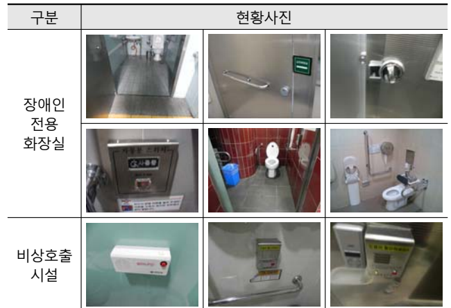
[Table 9] Picture of Urban Railway Station Toilet In Terms of Toilet for The Handicapped

잠금장치항목의 경우 국내기준에서 언급하고 있지 않지만 도출기준으로 국내현황을 조사하였을 때 누름단추식 자동문 버튼은 88%의 높은 설치율을 보인다. 이러한 결과는 실제 이용객들이 필요로 하는 요구가 반영된 결과로 볼 수 있으며 설치위치 등에 대한 상세기준마련이 필요하다.