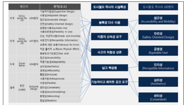
[Figure 2] Elicitation Urban Railway UD 6 Principles

디자인적인 사항을, 공정성은 시설 및 설비의 이용에 있어 물리적, 심리적인 차별을 받지 않도록 하는 사항으로 정의하여 5) 국내외의 기준 비교를 통해 도출된 항목과 해당 항목별 배려해야하는 교통약자 유형 및 고려되어야 하는 유니버설 디자인 원칙을 살펴보면 [Table 3]과 같다.