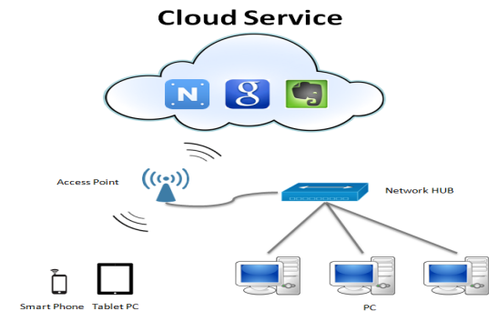
[Fig. 3] Configuration Model of Smart Work IT System

직원들과의 의사소통을 위한 협업 환경으로는 Google에서 제공하는 구글 앱스(Goole Apps.)를 이용하였다. 구글 앱스는 인터넷 비즈니스를 가능하게 하는 포털 서비스로 검색, 소셜 미디어, 웹호스팅, 일정관리, 주소록, 지도서비스 등 많은 서비스를 PC에서부터 모바일 환경과 연동하여 손쉽게 구축할 수 있는 장점이 있다.