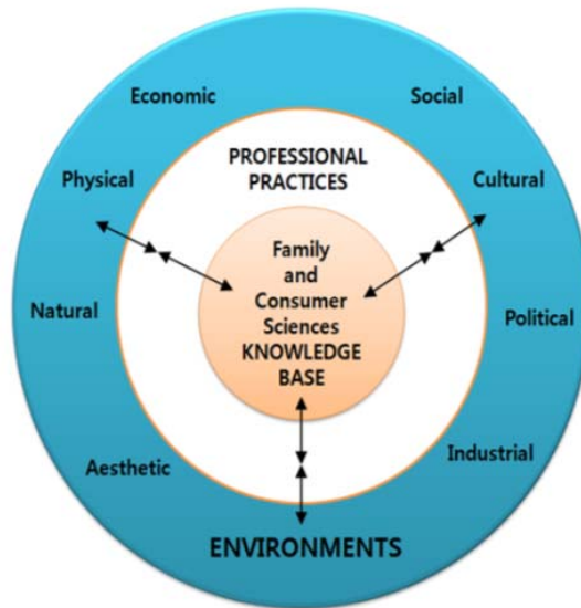
Figure 1. Family and Consumer Sciences Model for the Field

이 중 아이오아 주립대학교에서 제출한 ‘Family and Consumer Sciences(FCS)’ 제안서가 76%의 지지를 받아 선택되었다(Figure 1과 Figure 2). 이를 바탕으로 미국 가정학의 명칭은 1902년 LPC 4차 회의에서 결정된 Home Economics에서 Family and Consumer Sciences로 바뀌게 되는 전기를 맞이하게 된다. FCS의 제안서에는 FCS 명칭은 개인, 가족, 지역사회 간의 관계와 그들이 활동하는 환경에 통합적으로 접근할 수 있