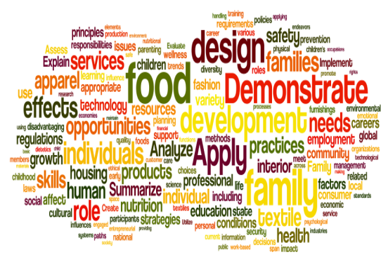
Figure 4. Family Field

본 연구에서는 'National Standards'의 핵심요소를 알아보기 위하여 데이터 시각화(Data visualization)의 한 방법인 워드 클라우드(Word Cloud)를 사용하여 분석하였다. 워드 클라우드(Word Cloud) 기법은 특정 데이터에 포함된 단어들의 빈도수를 시각적으로 표현해주는 분석기법으로 단어의 빈도수가 높을수록 큰 글씨로 나타나서 핵심 내용의 파악을 쉽게 도와준다. 가족 분야는 가족, 식품, 디자인 등 가정학과 관련된 개념(Figure 4)을 중심으로 역할, 기술, 요구, 기회 등으로 가족의 일상에 관계되는 핵심 개념들이 강조되었다. 진로분야는 개인, 기술, 관리, 역할, 효과, 커뮤니티, 조작 등의 개념(Figure 5)을 중심으로 개인의 자기 개발과 관련된 개념들이 강조되었음을 알 수 있었다.