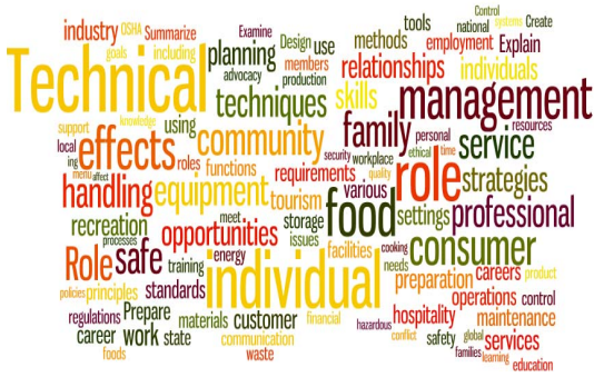
Figure 5. Career Field

‘National Standards’는 모학문인 가정학의 고유 개념들은 유지하되 개인과 가족의 역량, 글로벌 사회, 직업생활 등을 포함시켜 학습자가 당면하는 문제들에 대하여 깊이 사고하고 추론할 수 있도록 설계되었다. 특히 미국 국가 교육과정에서 추구하고 있는 진로 클러스터(Career cluster)를 반영하여 가정생활뿐만 아니라 일의 생활을 준비하게 하는 것을 가정과 사명으로 삼았다. 미국 교육현장에서 이루어지고 있는 진로 교육은 전체 교육활동 중에서 주변적으로 취급되고 분절적인 활동들로 구성되어 있는 우리나라의 진로 교육과 상당한 차이가 있다(Lim, 2009). 특히 7차 교육과정까지 가정과의 교육내용에서 다루어진 산업의 분류에 따른 직업의 종류에 따라 가정학과 관련된 직업의 탐색이나 준비를 하는 내용과는 본질적인 차이가 있다고 볼 수 있다. 일이나 진로, 직업 등과 같은 유사하게 연관된 주제를 다룬다고 해서 교양교육적인 가정과의 성격이 직업 교육적으로 변하는 것이 아니라는 주장을 뒷받침해준다. 오히려 교과 성격의 반영하여 여러 교과에서 서로 다른 관점과 국면을 다룰 수 있게 되고 이를 통해 일에 대한 총체적인 이해를 도모하고 긍정적인 가치관을 개발할 수 있게 한다(Lee, Choi & Yoo, 2002). 진로 교육이 비단 직업을 선택하기 위해 훈련받는 것이 아니라 학습자의 인생 계획(life plan)을 바르게 설계하도록 도와주고 당면하는 개인, 가족, 사회의 문제를 추론을 통하여 잘 해결해 나갈 수 있도록 사고를 확장시켜 성장시키는 데 역할을 다할 때 비로소 가정교과의 교육의 결과도 성과가 있을 것으로 생각된다. 이와 같이 ‘National Standards’는 가정교과의 비전과 사명감을 확립시키고 학습자의 역량을 함양시킬 수 있도록 개발되었다는데 큰 시사점이 있다.