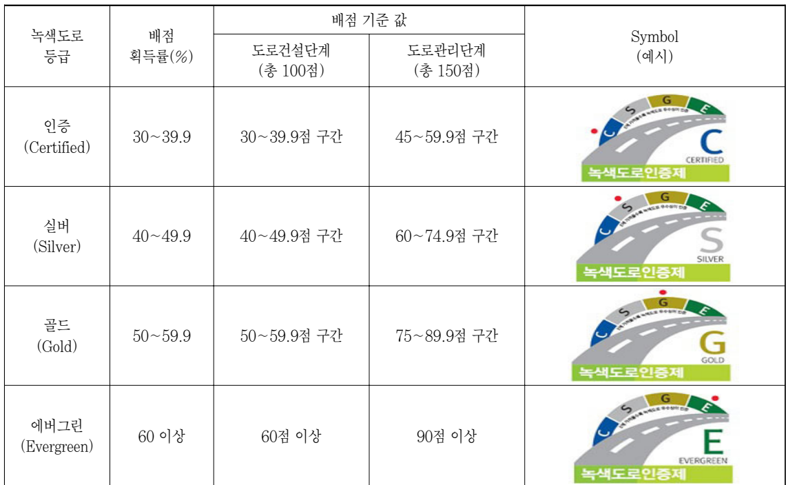
표 3. 녹색도로 등급별 배점 및 심볼