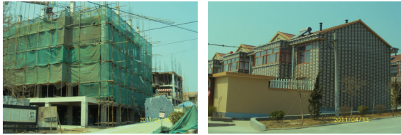
〈그림 4〉 ‘농민상루’가 진행되고 있는 산둥성 평라이시 소재 M촌 (2011년 4월)

132평방미터에 17만 위안, 5층 주택은 105평방미터에 21.5만 위안입니다. 새로운 주택은 사회주의 신농촌건설정책의 일환으로 실시되는 농촌구촌개조(農村舊村改造) 사업으로 실시되었습니다. 마을 현황을 보면, 농가는 260가구, 인구는 660명, 농지는 약 2,200무입니다. 주로 사과를 재배하고 그 외, 포도, 앵두, 옥수수, 땅콩을 재배합니다. 1인당 평균 경작면적은 3무 반이고 1인당 평균소득은 1만 위안입니다. 가족이 2인인 경우에는 2만 위안이 되기 때문에 소득은 높은 편입니다. 마을 내 신축건물이 지어지면서 외지인들이 전입하고 하는데 이에 대해 농민들은 크게 개의치 않는 분위기입니다. 오히려 외지인들은 기술이 있고 소질(능력)이 있기 때문에 반기는 분위기입니다. 현재 우리 마을에서 50세 이상의 농민은 사과농사를 짓고 50세 이하 농민은 대부분 외지에 나가 일합니다. 11)