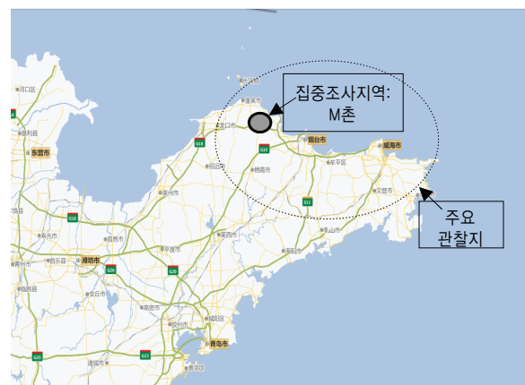
〈그림 1〉 본 연구 관찰지역 및 집중조사지역(M촌) 위치 (산둥성 북동지역 상단)

본 연구의 연구방법 및 자료 수집은 본 연구자가 2009년~2014년 기간 동안 중국 산둥성의 옌타이시(煙台市)와 웨