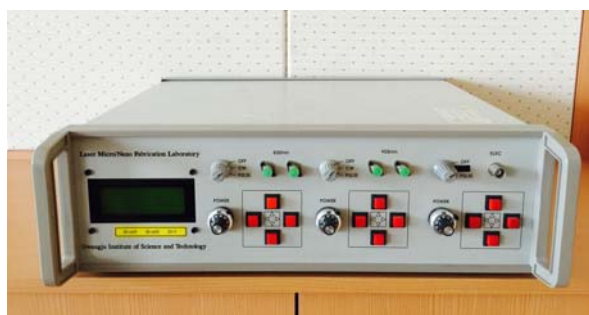
Fig. 1. Laser acupuncture system

fibula head 전하방의 요함처에서,懸鍾(GB 39 )은 fibular 면쪽으로 popliteal crease에서 lateral malleolus의 prominence까지의 연결선상에서 lateral malleolus 상방에서 인체와 상응되는 부위에 취하였다.