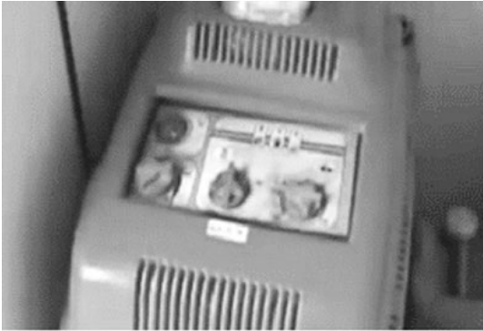
사진 1. 경유 사용 열탕 고압소독(세척)기