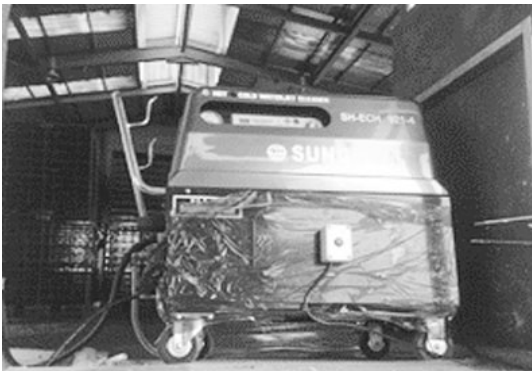
사진 2. 전기사용 열탕(스팀) 고압소독기