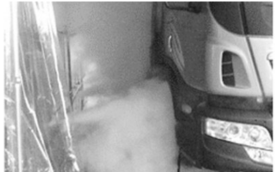
사진 7. 바퀴부분에 분사되는 스팀