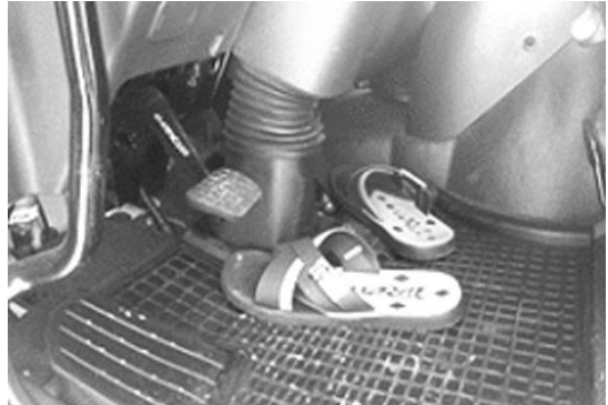
사진 3. 출하차량 운전석 고무매트