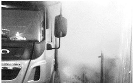
사진 8. 스팀소독 장면