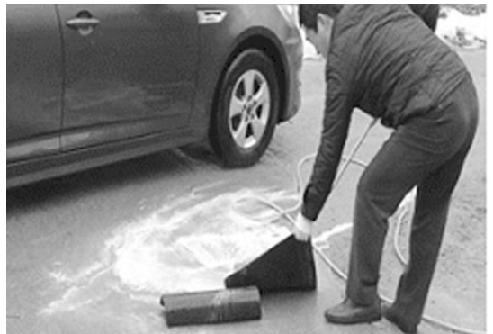
사진 4. 고무매트 소독장면(오염물질 제거 용이)