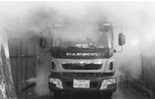
사진 6. 스팀소독 장면