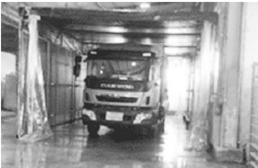
사진 5. 도축장에 설치된 차량 소독용 챔버

따라서 거점소독소가 농장 출입 전 완벽한 소독을 실시하여 병원체가 free하다는 것이 담보될 수 있는 소독방법을 실시한다면 고병원성 AI를 포함한 각종 가금의 전염병을 효과적으로 차단할 수 있을 것으로 기대할 수 있을 것이다. 사진 5~8은 도축장에 설치한 차량 스팀소독 시설 및 소독장면이다. 양계