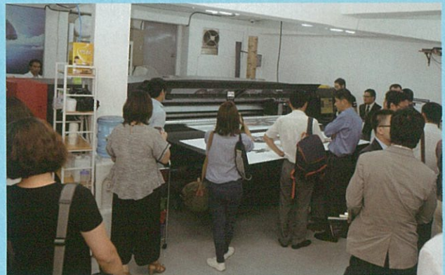
와우애드에서의 뷰택 시연 행사