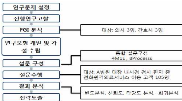
Fig. 1. Research Process

사 3명, 간호사 3명)를 통한 탐색적 조사로 FGI를 실시하였다. A병원의 대장 내시경 사전 전화상담 후 약 처방을 하는 원격의료서비스를 대면의료서비스와 비교하여 프로세스, 대상, 의료범위, 시간, 비용 및 의료서비스 품질 요인, 원격의료서비스 품질 요인 등에 유의한 차이가 있는지 비교 분석하였다. 사회적 진행에 따라 4단계(Warm up→ Bridge→ Main→ Ending stage)로 구성하여 2시간에 걸쳐 진행하였다.