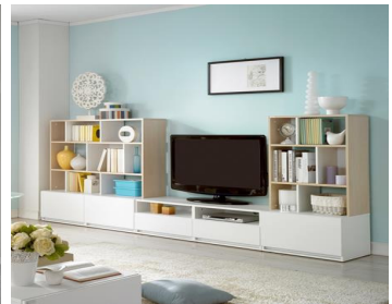
Fig. 5.3. Module type