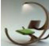
Fig. 3.4. Chairs Reading