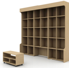
Fig. 7.2. Screen Projector Type 2