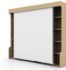
Fig. 7.3. Screen Projector Type 3