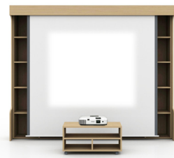
Fig. 7.4. Screen Projector Type 4