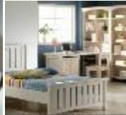
Fig. 3.5. Bedroom Desk and bookshelf