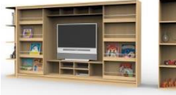
Fig. 6.3. Combination Modules Type 3