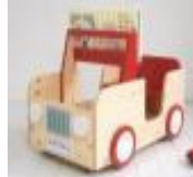
Fig. 3.3. Car-shaped bookshelf