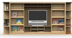
Fig. 6.2. Combination Modules Type 2