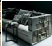
Fig. 3.6. Comfortable Sofa & Bookshelf