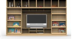
Fig. 6.4. Combination Modules Type 4