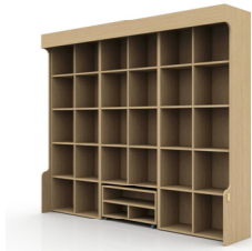
Fig. 7.1. Screen Projector Type 1