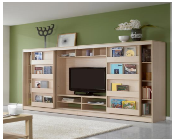
Fig. 5.2. Sliding type