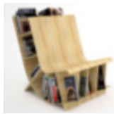
Fig. 3.1. Bookshelf & Chair