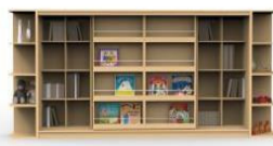
Fig. 6.1. Combination Modules Type 1