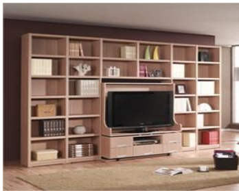
Fig. 5.1. Rotary type