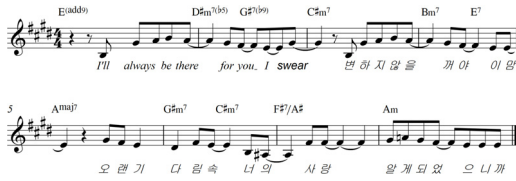
Fig. 6. Phrase of ‘To My Boy’

는 주장하였다. 피고인 작곡가 ‘박진영’은 이 사건에서 원고의 곡과 유사한 선행저작물을 예로 들어 원고의 곡이 대중음악에서 자주 사용하는 관용구라며 원고의 음악은 창작성이 없다고 주장하였다. 이 사건에서 법원은 두 곡의 유사한 부분인 후렴구를 검토해본 결과 전반부 4마디의 멜로디, 화음, 리듬이 동일하다며 저작권 침해가 인정된다고 판시하였다. 해당 악보를 통해 법원의 판단을 살펴보도록 하자.