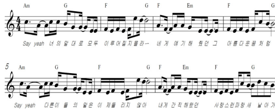
Fig. 2. Whynot 'Blue Bird' key of C

마디는 일치하지 아니하며 후렴구 두 번째 마디의 동형 진행부분이 유사하나 피고가 제기한 다른 곡(오!가니, 지중해)에서도 많이 사용되어지는 관용적 표현으로 원고의 창작성을 인정하기 어렵다고 판단했다. 그러므로 피고와 원고의 음악에 침해하지 않았다는 판결을 하였다. 다음은 해당 악보를 통해 법원의 판단을 살펴보도록 하자.