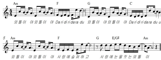
Fig. 3. CNBLUE 'Loner' key of C

[Fig. 2]은 원고의 “파랑새” 작은악절(phrase) 부분이고, [Fig. 3]는 피고의 “외톨이야”의 작은악절(phrase) 부분이다. 이중 법원은 두 음악의 각각의 두 번째 마디 부분이 동일하지만 유사한 부분은 이전에 몇몇 곡에서도 발견된다고 하여 선행 저작물의 예를 들었다.