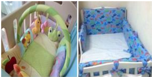
Fig. 2. Infant bed

영아반에는 아기를 위한 침대, 바운스 스윙 등 영아의 개별적 욕구를 위한 환경이 마련되어 있다. 개인차가 많이 나는 영아반에서는 일상적 양육활동을 위한 공간을 구성해 놓아야 하며, 이러한 공간을 구성할 때에는 영아의 개월 수와 발달, 선호에 맞는 교재·교구를 고려해 선정해야 한다.