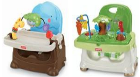
Fig. 4. Booster

현재 우리나라의 교사 대 영아의 법정 비율을 살펴보면 만 0세의 경우 교사 1명당 3명의 영아를, 만 1세의 경우 교사 1명 당 5명의 영아를 보육할 수 있도록 허용한다. 혼합반 구성원칙에 의하여 만 0,1세는 같은 반에서 보육이 가능하다. 그러나 이 때는 가장 급진적인 발달을