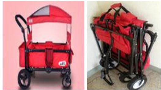
Fig. 6. Wagon

실외놀이 환경의 질적 수준은 영아들의 놀이 수준과 행동에 영향을 주므로 영아들의 발달에 적합한 실외놀이 환경과 시설을 준비해야 한다.[10] 구체적으로는 감각운동적으로 자신을 둘러싼 세상에 대하여 경험하고 학습하는 시기의 영아들을 위하여 이에 적합한 다양한 감각적 경험과 운동놀이를 촉진할 수 있도록 구성되어야 한다. 또한 끊임없이 새로운 발견과 탐색이 가능한 도전적인 환경이어야 하며, 단순하고 위생적이며 영아의 안전을 보장해 줄 수 있어야 한다.[11] 만약 무지개 손이나 산책용 끝차와 같은 신체발달 수준에 적합하고 영아들의 이동을 돕는 교재·교구가 구비되어있다면 실외놀이 탐색이 가능함과 동시에 보행 시, 안전도 보장한다. 반면, 이