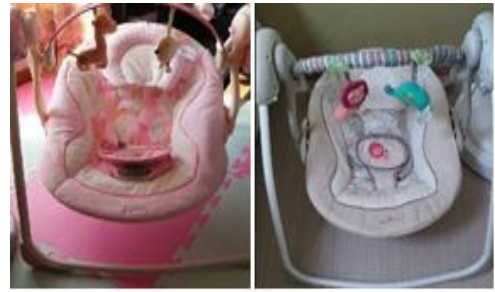
Fig. 3. Bounce swing

“서현이는 점심시간이 되면 부스터에 앉아서 기다려요. 그런데 정우는 10개월밖에 안된 아가예요. 오전에 분유를 먹다가도 잠이 들기도 하고, 바운스에 눕는 것을 좋아해서 거기서 먹다가 잠이 들기도 하고 친구들 놀이하는 것을 보기도 하고, 제가 품에 안고 책을 읽어주기도 하는데, 바운스에 비스듬히 누워서 듣는 것을 더 좋아하는 것 같아요”