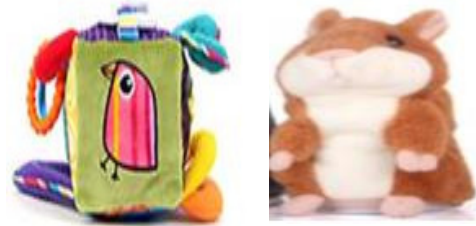
Fig. 1. Sensory material

“유아들의 경우 등원할 때 00친구가 기다리고 있대, 어제 만들던 비행기 다시 만들어볼까? 라고 말하면서 부모님과 인사를 나누고 올 수 있는데 영아들의 경우는 그렇게 하지 못해요. 그래서 영아가 흥미를 끌 수 있는 놀잇감을 가지고 나가서 엄마와 헤어질 수 있게 해요.