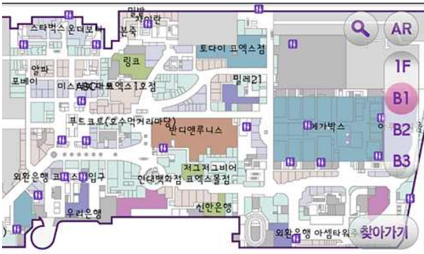
Fig. 1. mycoex ( http://blog.coex.co.kr/97 )

마이코엑스는 코엑스몰에서 출시한 모바일 어플리케이션이다. 실내 내비게이션 서비스를 세계 최초로 상용화하였다. 마이코엑스는 코엑스 내부에 설치된 약 3400여개의 와이파이 AP