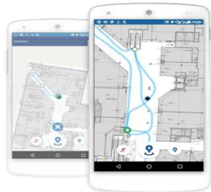
Fig. 10. IndoorAtlas ( https://www.indooratlas.com/our-platform/ )

SK플래닛과 전략적 파트너십을 체결한 실내 위치정보기술 업체 인도어아틀라스는 지구 자기장을 이용해 건물 내부의 위치를 알려주는 기술을 보유한 스타트업이다. 2012년 안 하버리넨(Janne Haverinen) 핀란드 올루(Oulu)대학 교수와 과학자들이 설립한 회사다.