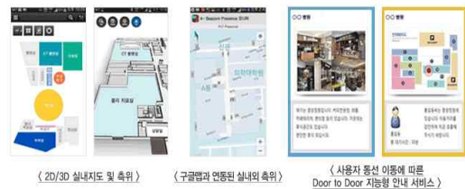
Fig. 7. Indoor LBS - AbilitySystems ( http://www.abilsys.com/ )

어빌리티시스템즈는 사물인터넷(IoT) 기술의 총아로 각광받고 있는 저전력 블루투스(BLE) 4.0 기술인 비콘을 활용해 경북대학교병원에 실내 위치 측위 및 길찾기 시스템을 구축했다. 이는 SK텔레콤에서 분당서울대병원에 적용한 ‘스마트 병원’ 솔루션보다 일찍 구축되어 최초의 대학병원 실용사례로 꼽힌다.