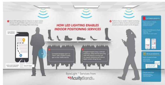
Fig. 4. ByteLight Services: Indoor Positioning (http://www.acuitybrands.com/products/lighting)

바이트라이트는 미국의 스타트업 기업으로 LED 조명을 이용한 Indoor Positioning System(IPS)기술을 개발했다. 바이트라이트가 개발한 주파수 감지 기술은 LED 조명이 지속적으로 깜빡이며 보내는 신호를 감지한다.