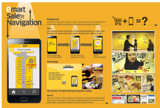
Fig. 3. emart sale navigation (https://sites.google.com/site/heavenlydesigner/works)

ETRI와 이마트가 함께 개발한 쇼펍센터 실내 측위 서비스이다. 본 서비스를 통해서 추구했던 가치는 실패 측위로 고객들이 원하는 물건을 쉽게 찾고 해당 상품의 쿠폰이나 상품 정보를 제공하도록 하는 것이다. 측위를 위해 필요한 하드웨어는 쇼펍 카드에 설치되어 있는 LED 센서이다[11].