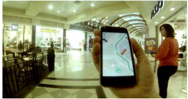
Fig. 9. Inside – Shopcloud ( http://www.directionsmag.com/ )

인사이드는 와이파이를 이용한 삼각 측량보다 사용자의 위치 정확도를 높이기 위해서 스마트폰에 장착된 카메라, 자이로 센서와 같은 하드웨어와 스마트폰의 각종 센서들을 이용한다.