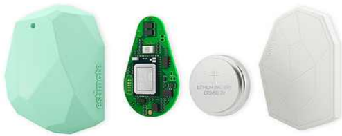
Fig. 5. BLE Beacon -Estimate ( http://blog.estimate.com )

BLE는 사운드 비콘과 비교 시, 단말의 소형화, 저전력, 벽과 같은 실태환경의 영향을 최소화라는 장점을 가지며, Near Field Communication(NFC)와 비교 시 전송거리가 약 50미터까지 넓어 측위 기능을 통한 모바일 광고와 결제 서비스를 통합할 수 있는 장점을 가진다[1].