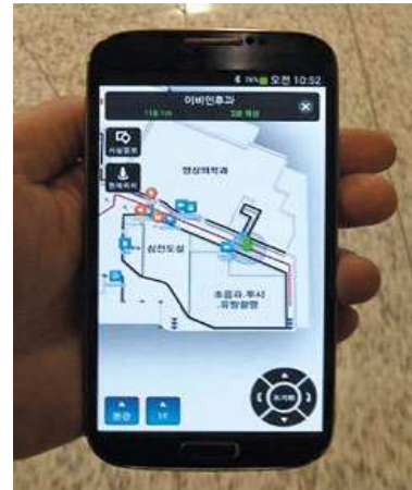
Fig. 6. SKT telecom Smart Hospital Solution (SK Telecom)

경기도 성남에 있는 분당 서울대 병원을 찾는 사람들은 신기한 경험을 할 수 있다. 로비에서 스마트폰으로 병원 앱을 실행하면 화면에 건물 내부 평면도가 펼쳐지면서 길 안내 서비스가 시작된다. '이비인후과'라고 목적지를 입력하자, 현재 위치에서 에스컬레이터를 타고 어디로 가야 하는지 이동 경로가 화살표