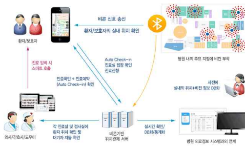
Fig. 8. KyungPook National University Hospital – IndoorPlus ( http://www.abilsys.com/ )

본 절에서는 대표적으로 실내 내비게이션 구축을 위한 측위 기술들 외에 새로운 기술들을 소개한다.