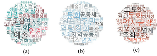
Fig. 3. Deduction the Keyword from Gong-ju related plan (a) Word cloud from 2020 urban basic plan in Gong-ju (b) Word cloud from revitalization plan for urban regeneration leader region Gong-ju (c) Word cloud from basic plan for ancient city's preservation & promote

지역적합성 검토에는 워드클라우드 분석을 이용하였으며, 공주시 상위계획 및 관련계획에 대한 분석을 통해 공주시 도시재생과 관련된 핵심키워드를 Fig 3와 같이 도출하고 이를 토대로 관련지표를 선정하였다.