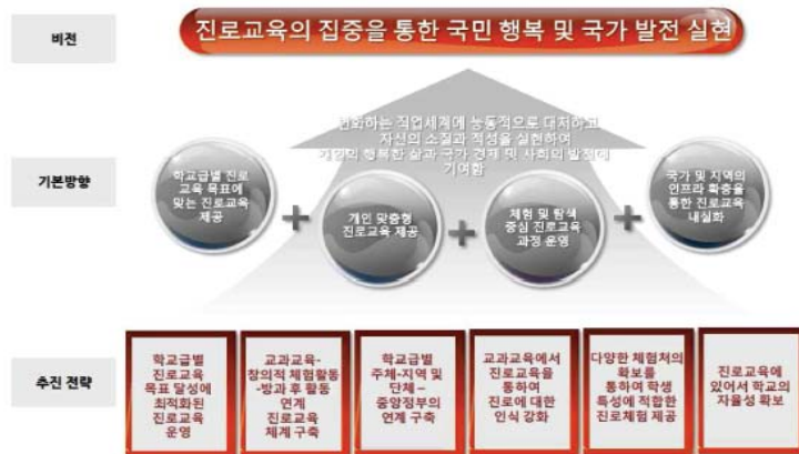
Figure 1. Outline of career education intensive semester & grade system

능동적으로 대처하고 자신의 소질과 적성을 실현하여 개인의 행복한 삶과 국가 경제 및 사회 발전에 기여하는 것을 목적으로 한다. 이를 위해 특정 학년 또는 학기를 정하여 진로체험 교육 과정을 집중적으로 운영하는 제도이다. 진로교육 집중학년·학기제의 운영은 진로교육법과 교육부에서 제안한 진로교육 기본계획과 관련이 있다. 진로교육법 제정에 앞서 제1차 진로교육 종합계획(2010~2013)에서는 학교진로교육의 목표와 성취기준(2012)을 확립하고, 학교교육과정과 연계한 진로교육 강조 및 진로전담교사 배치 등의 기반은 마련하였다(교육과학기술부, 2010). 하지만 진로 심리 검사, 진로 체험 등을 학급 단위로 실시하여 학생 개개인의 요구를 반영한 맞춤형 진로교육이 미흡하고, 진로 체험 프로그램의 양적 확대에 치중한 나머지 프로그램에 대한 질 관리는 부족하다는 문제점이 제기되었다(Kim, Bang, & Jung, 2012; Min, Bae, & Han, 2012; Jung et al., 2015; 교육부, 2016a). 이에 교육부는 제2차 진로교육 5개년 기본계획을 통해 진로교육의 내실화를 위해 진로교육법 제정 및 2015 초·중등학교 교육과정 개정으로 등으로 학교급별 특성과 요구를 반영한 진로교육을 실시하고자 하였다(교육부, 2016b). 특히, 진로교육이 강화된 학교 교육과정 운영의 정착을 위해 진로 교육과정 운영의 확대, 진로교육 집중학년·학기제를 통한 진로교육 활동을 모색하고 있다. 진로교육 집중학년·학기제 운영의 경우, 중학교 단계의 자유학기제와 연계하여 우선 일반고 1학년 학생을 대상으로 진로교육 집중학기제를 시범 실시하고, 점진적으로 확산을 도모할 계획이다. 진로교육 집중학년·학기제의 개요는 <Figure 1>과 같다. 성공적인 진로교육 집중학년·