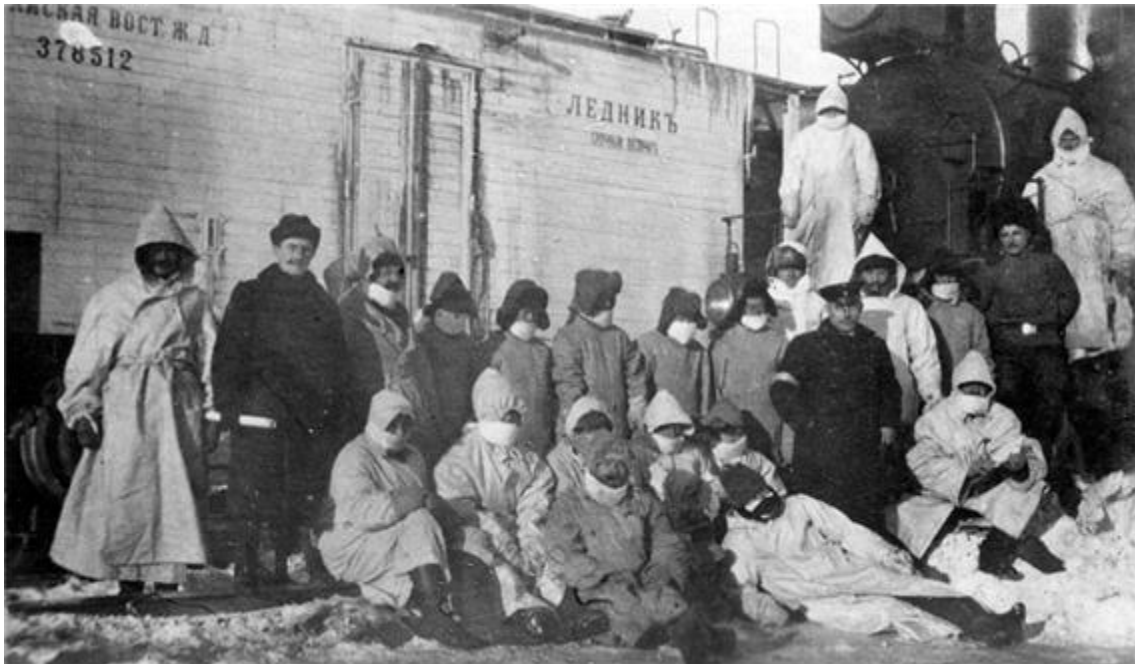
Fig. 3. Russian doctors involved in epidemic prevention work

지구의 외국인 수병과 중국 주민들에게 접종을 진행하였다. 이태리 나블러스(那不勒斯) 황가대학실험병리학 교수 개리오체(盖里奥蒂)는 부가전(傅家甸)지역의 방역사업인원에 대하여 효과적인 훈련과 지도를 진행하였다. 성경의학원의 미국의사결극슨 교수는 황고툰 기차역의 철도방역사업을 책임지었는데 자기의 고귀한 생명을 바쳤다. 이렇게 많은 외국인들이 국제적 인도주의로부터 출발하여 동북지구 전염병 퇴치와 연구사업에 참가하였으며 헌신적인 공헌을 하였다.