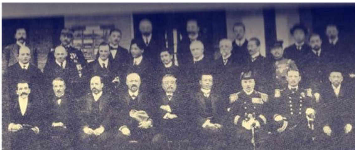
Fig. 1. Representative group photo of Bongchon International Black Death Conference

2003년 “사스”(호흡기성 전염병)가 유행하는 기간 동안 외지에서 오는 학생들은 약 15일 정도의 격리가 있었고 방마다 소독하고 통풍이 잘되게 하였으며 열이 나면 바로 검진하여 입원 후 격리하였다. 이와 같은 전염병 유행은 이미 1910년에도 중국의 동북지역에서 세계를 놀라게 한 전염병사건이 있었다. 1910년 10월 중·러 국경의 작은 도시 만주리에서 첫 병례가 발견되었고 그 후 신속히 전파된 페스트이다. 같은 해 11월에 하얼빈에서 첫 번째 환자가 출현하였으며 12월에 치치할, 장춘으로 퍼졌고, 이듬해 1월에는 지린, 선양, 다이렌, 산해관을 거쳐 텐진, 베이징, 보우딩에 까지 전파되었다. 심지어 발해해협을 넘어 산둥반도에 상륙하였으며 지난과 칭도에까지 영향을 주었다. 페스트가 유행한 수개월동안 전후로 5만여명의 고귀한 생명을 잃었다. 이러한 재난 앞에서 당시 청정부는 적극적인 방역조치를 취하였고 세계 여러 나라들에 협조를 요청하였다. 특히 페스트가 끝나지 않은 시기에 국제페스트회의를 소집하였다. 바로 1911년 4월 3일 봉천(현재 선양)에서 11개 나라에서 온 수십 여명의 의사들이 모여 회의를 개최하였다. 세계역사상 처음으로 개최되는 국제페스트회의였고 중국역사상 처음으로 개최되는 국제과학회의였다.