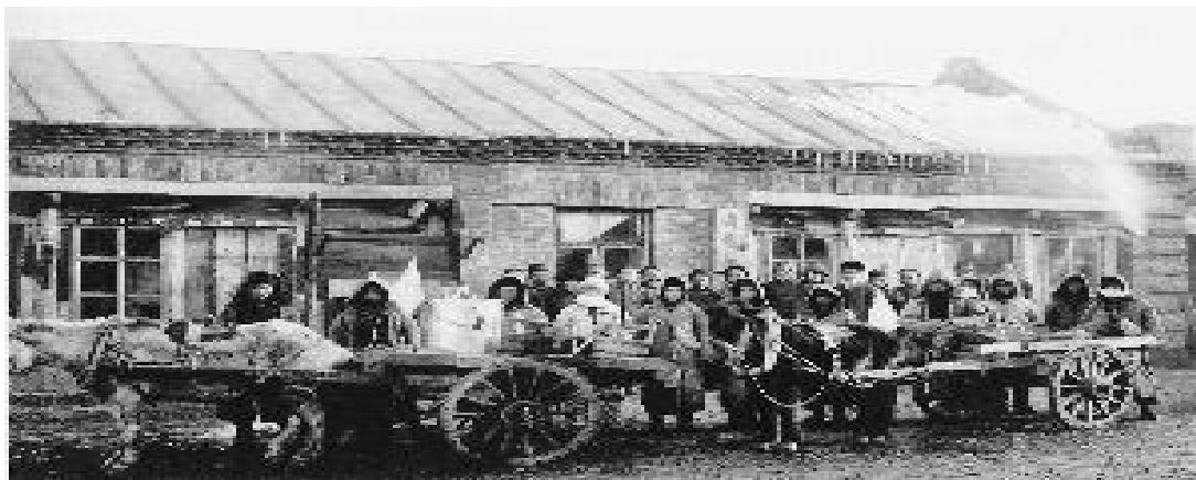
Fig. 4. Fu Jiadian disinfection car ready to start

이 시기 일본은 러시아와 마찬가지로 동북지방에 페스트가 유행된 시기를 기회로 여기고 자기들의 세력을 확충하고자 하였다. 러시아와 다르다면 다른 나라 세력이 이 기회에 중국동북지구에 들어와 일본의 세력범위-동북남부지구에서의 "독립왕국" 지위를 깨뜨릴 가 걱정하였다. 그리하여 일본도 일련의 적극적인 방역조치들을 취하였다. 페스트가 장춘에서 유행할 적에 관동도독부와 남만주철도주식회사는 이미 손을 잡고 "연합방역국"을 구성하였으며 주요 기차역부근에 격리구를 설립하고 군대도 증파하였다. "연합방역국"의 총부를 봉천에 세웠으며 안동, 여순, 대련, 우장, 요양, 철령, 장춘 등지에 분국을 설립하였다. "연합방역국"의 성원 중 경찰 인원수가 414명으로 의사 인원수의 6배에 달하였다. 이로부터 알 수 있듯이 "연합방역국"의 조직은 의료조직이라기보다 군사조직이라 함이 타당할 것이다. "연합방역국"은 봉천지방당국에서 진행되는 방역이 제대로 되지 못했다는 구실로 자기들 맘대로 사람을 파견하여 집집마다 검사할 것을 결정하였다. 비록 봉천당국에 거절을 당하였지만 "연합방역국"의 사업인원들은 여전히 제 맘대로 하였다. 그리고 남만주철도주식회사는 공개적으로 일본의 활동범위는 만주 전체여야 한다고 하면서 만주의 모든 주민들에게 도움을 주겠다고 하였다. 일본은 이러한 조직 준비와 여론 조성 외에도 중국정부에 외교적 압력을 가하였다. 봉천주재 일본 총영사는 동삼성총독 석량한테 일본경찰과 중국경찰이 협력하여 중국인 주민집에 가서 방역상황을 검사하도록 하는 사항을 제출하였다. 이에 석량은 중국인 주민에 대한 행정관리권은 중국에 있다고 천명하면서 일본관리 권한 밖에서의 일본경찰의 활동은 환영을 받지 못할 것이라고 못 박았다. 그렇지만 일본의 간섭과 침투는 계속되었으니 봉천국제페스트회의에서도 그러한 모순과 문제들을 드러냈다. 청정부의 적극적인 대응과 미국과의 협력으로 봉천국제페스트회의는 성공적으로 개최되었다. 봉천국제페스트회의를 통해 청정부는 동북지구에 대한 주권소유를 각 국에 보여줬으며 나라의 영토안정을 수호하였다. 물론 일본과 러시아의 중국동북지구에 대한 진일보로 되는 침략을 어느 정도 저지하였다고 볼 수 있다.