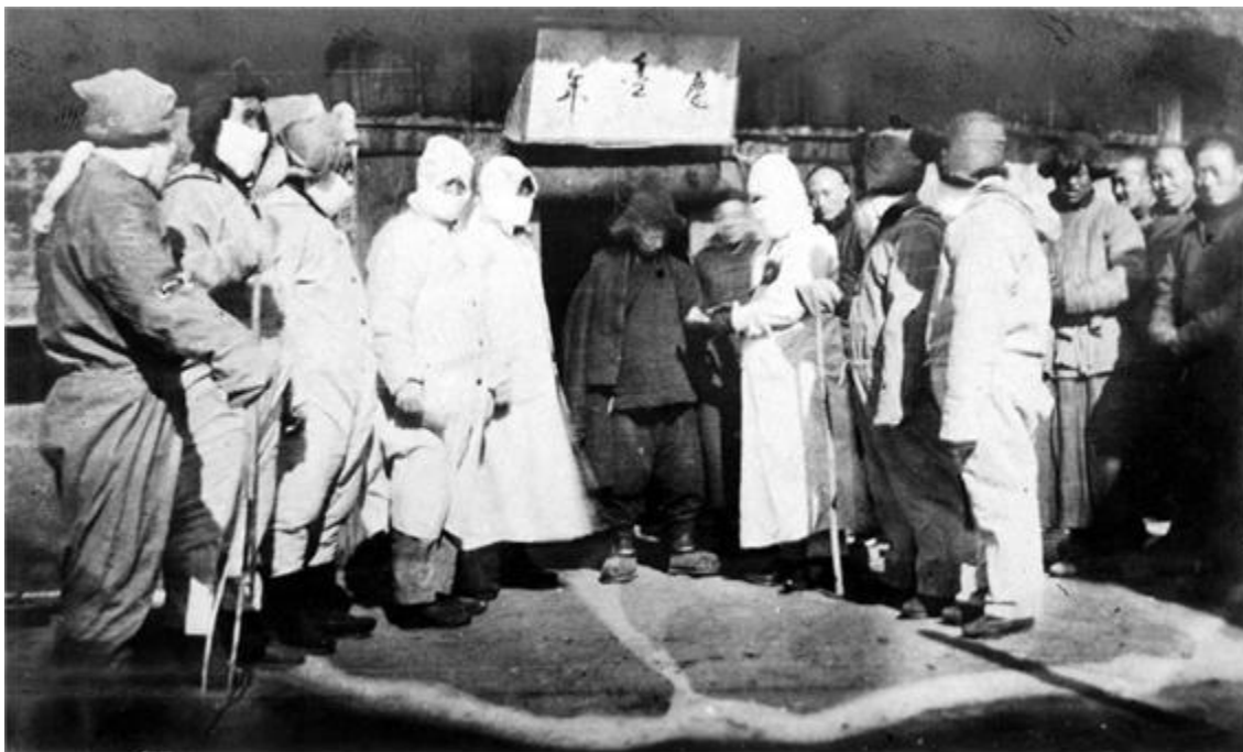
Fig. 5. The medical staff of the epidemic prevention hospital checks the isolated patients

여기서 변경지역으로서의 화룡현의 방역을 살펴본다면 조선과 접경한 화룡현의 방역사업은 특별히 중요하게 보여 진다. "화룡현에 소속된 두만강 연안 300여리 구간에 18곳의 연안요충지가 있다. 일본과 조선상민의 왕래가 끊이지 않으니 만약 조금만 소홀하여 방범에 힘쓰지 않는다면 역병이 변경에 이르게 된다. 그러면 일인들이 기회를 타 우리의 내정을 간섭하게 될 것이며 우리의 주권을 침해하는 중대교섭에 이르게 될 것이다." 이러한 위기의식속에서 화룡현에서는 현성내에 방역국을 설립하였고 두만강 연안의 각 교통요도에 방역 혹은 검역분소를 설립하여 지나다니는 일체 인원, 물품에 대해 검사를 하고 소독예방을 진행하였다. 화룡현 방역국 국장은 지현(팽수당)이 직접 겸임하였으며 문서 겸 서무는 경무장이 겸임하여 국장의 명령을 집행하거나 방역국 각항 사무를 집행하였다. 그리고 서의 한명이 위생과원을 겸임하였고 중의 한명이 권학원을 겸임하여 방역이나 진역 각항 사무를 분담하였다. 각 방역, 검역분소에 순찰장 한명을 두고 위생경찰 두명을 두어 규장제도에 쫓아 검사를 실행함으로써 전염병 예방을 하였다. 방역조치로는 물론 교통을 차단하여 전염병 발생지역에서 오는 물품이나 동물의 왕래를 금하였을 뿐 아니라 위생순경을 각 향, 촌에 파견하여 백성들이 청결을 지켜 위생에 주의하도록 하게 하였다. 또한 백성들이 귀를 잡는 것을 고무격려 하였다. 이외에 화룡현에 흘러들어 온 하층노동자들을 연결피한소로 보내는 등 방역에 온갖 심혈을 기울였다. 이렇게 연변지방정부의 적극적인 방역조치로 말미암아 방역에 일정한 성과들이 있었다.