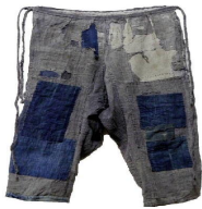
〈그림 1〉 보로의 종류-용도: 노동복 하의 (출처: https://www.kimonoboy.com/jackets/popup_folder/monpe-111.html /검색일:2016.5.23.)

재활용을 목적으로 한 기법이기 때문에 원단 조각의 크기와 문양, 질감이 각각 다르며 이러한