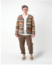
〈그림 17〉 순수미-직조기법, 쿠온 2016 F/W 컬렉션 (출처: http://www.kuon.jp/ 검색일: 2016.6.10.)