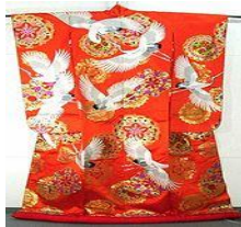
〈그림 7〉 꾸밈:기모노

(출처: https://en.wikipedia.org/검색일:2016.5.23. )