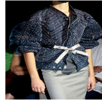
〈그림 10〉 보로의재해석: 마틴 마르지엘라 2011 쿠튀르 컬렉션