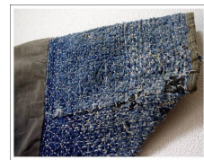
〈그림 6〉 보로의 종류-기법:자수 (출처: https://www.kimonoboy.com/jackets/popup_folder/bj-9018.html/ 검색일:2016.5.23.)