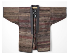
〈그림 5〉 보로의 종류-기법:직조