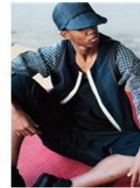
〈그림 14〉 간결미-키리코 (출처:www.kirikomade.com/검색일:2016.6.8.) 〈그림 15〉 간결미-쿠온 2016 S/S 컬렉션 (출처:http://www.kuon.jp/검색일:2016.6.8.) 〈그림 16〉 간결미-사스케치 패브릭스 (출처:www.saqatchfabrix.jp/검색일:2016.6.8.)

에서도 보로에서 영감을 받은 의상들이 증가되고 있는 추세이다. 일본 국내의 패션 브랜드들은 데님 브랜드가 주로 보로를 재해석하고 있고, 전통 섬유 공예를 바탕으로 한 패션 브랜드들에서도 보로의 재해석은 나타나고 있다. 이와 같은 사례들을 다음 장에서 반 꾸밈 미의식 별로 분류하고자 한다.