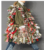
〈그림 24〉 추의 미-빅터&롤프 2016 FW 쿠티르 컬렉션