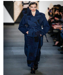
〈그림 11〉 간결미-카피탈& 랄프 로렌 〈그림 12〉 간결미-루이 비통 2012 S/S 보로마니아 〈그림 13〉 간결미-젠 카오 2013 F/W