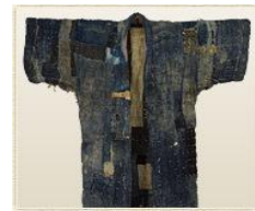
〈그림 8〉 반 꾸밈:보로