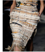
〈그림 20〉 순수미-직조기법, 알투자라 2014 S/S 컬렉션 (검색일: 2016.6.10.)