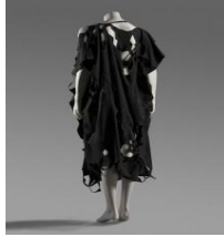
〈그림 9〉 현대패션의 반 꾸밈 적 요소: 요지야마모토 Dress-1983 (출처:www.wornthrough.com/검색일:2016.5.23.)