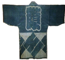
〈그림 2〉 보로의 종류-용도: 소방용 의복 (출처: http://www.designbyaika.com/sashiko-discussions/sashiko-history-firefighters-jacket/ /검색일:2016.5.23.)