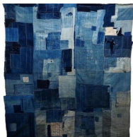
〈그림 4〉 보로의 종류-기법:패치워크