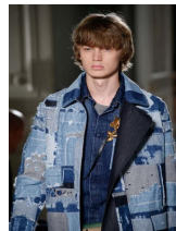
〈그림 21〉 추의 미-발렌티노 2016 S/S 컬렉션