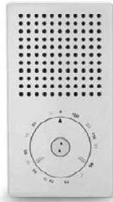
Braun T3 Transistor Radio 1958