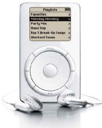
Apple I pod 2001

총괄할 당시, “아이맥에 관한 쟁점의 핵심은 칩의 속도나 시장 점유율이 아니다. 대신 우리는 소비자들이 이 제품을 어떻게 느끼는지, 그리고 어떤 부분에서 감동을 받을까에 대한 궁금증을 먼저 해결해야 한다”라고 이야기를 하며 회의에 참석한 모든 이에게 감정적인 교류를 이끌어내고자 했다. 이어 그는 기존 업계가 가지고 있는 제품들에 대해 지적을 한다. 대중에게 많은 것을 끌어 내기 위해 불필요한 기능이 혼재된 있는 제품을 판매하여 사용 시 편의성의 대한 배려가 부족했다는 것이다. 사용자가 느낄 수 있는 편의성을 예측하고, 그것이 디자인에 철저히 스며들어 있는 것이란 무