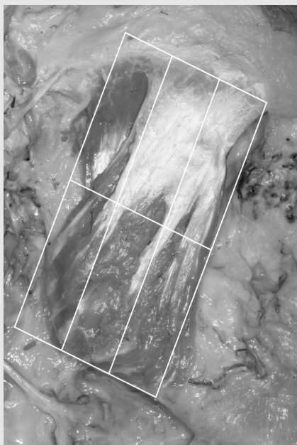
그림 3. 깨물근의 표면을 6등분하여 깊은아래힘줄이 위치해있는 부위에 따라 3개 유형으로 분류하였다.