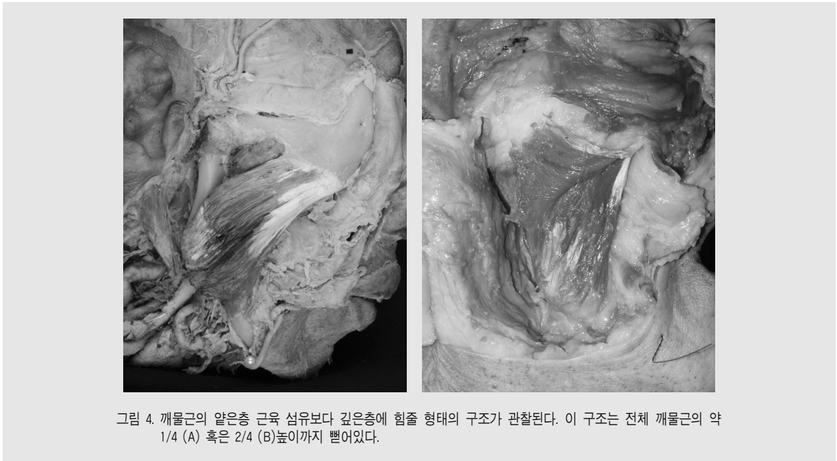
그림 4. 깨물근의 얇은층 근육 섬유보다 깊은층에 힘줄 형태의 구조가 관찰된다. 이 구조는 전체 깨물근의 약 1/4 (A) 혹은 2/4 (B)높이까지 뻗어있다.

눈 독신을 주사하는 경우, 대부분의 경우에는 근육의 얇은층인 깨물근 아래쪽 부분의 위축이 일어나지만, 종종 “paradoxical masseteric bulging”이라고 불리는 합병증이 생기는 경우가 있다. 지금까지는 깨물근 얇은층의 구조가 단순한 근육으로만 구성된 부분으로 생각되어 왔지만, 이번 연구에서 밝힌 깨물근 얇은층에 위치하는 힘줄구조로 인해 보툴리눔 독신 주사 시, 약제의 전반적인 근육으로의 퍼짐을 제한할 것으로 예상된다.