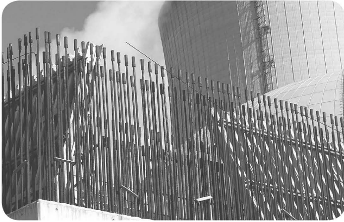
〈그림 2〉 스위스 Goesgen 원전의 사용후핵연료 습식저장조 보강 공사

기관을 통해 승인된다. 예를 들어 영국에서는 Office of Nuclear Regulation(ONR)이 수행하는 일반 설계 평가[Generic Design Assessment(GDA)]가 진행되며 현장과 운영자 특정 라이선스가 뒤따르게 된다. 실제 이것이 의미하는 바는 부지 별로 각기 다른 시나리오가 원자력 시설 건축물을 보호하기 위해 적용되어야만 한다는 것을 의미한다.