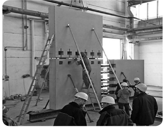
〈그림 4〉 블록 성형 콘크리트 시스템과 커플러 시스템이 적용된 모의(Mock-up) 테스트

식저장소 시설 건설에 참여하였고, 최근에는 AREVA가 핀란드에 건설중인 Olkiluoto 3호기 (EPR, 1,600MWe) 건설에도 참여하여 원자로 Double Containment 설계와 시공을 성공적으로 구현하였다.