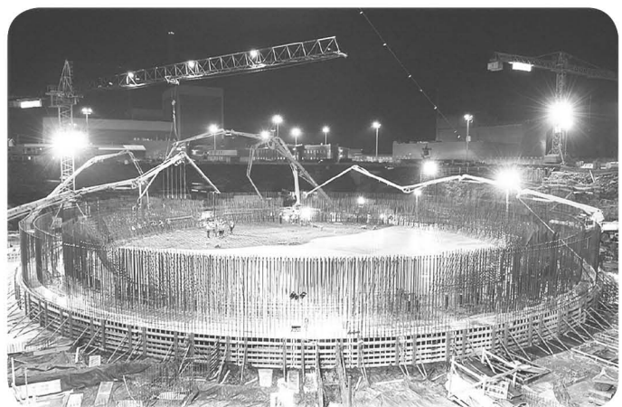
〈그림 3〉 핀란드 Olkiluoto 3호기 원자로건물 보강 공사